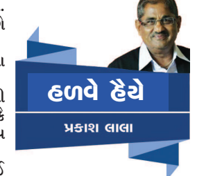
હળવે હેંચે પ્રકાશ લાલા