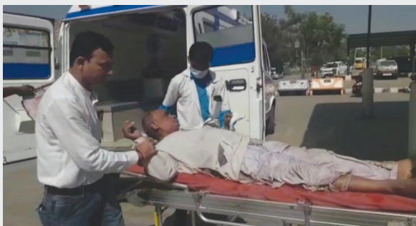
રોજિંદા અકસ્માત ના બનાવો માં વધારો થતો જોવા મળી રહ્યો છે તેવામાં વધુ ગતરોજ ધાનેરા હતી. જેમાં બે બાઈક સામ-સામે ટકરાયા હતા જેને પગલે ઘટના સ્થળે લોકોના ટોળા એકત્રિત

થઈ ગયા હતા અને ૧૦૮ ને જાણ કરવામાં આવતાં ૧૦૮ ની ટિમ પણ તાબડતોબ ઘટના સ્થળે પહોંચી હતી અને ઘટનાની જાણ પોલીસ ને થતાં પોલીસ પણ ઘટના સ્થળે દોડી આવી હતી. આ ઘટનામાં ધનોલ અને રવીયા ગામના બે આશરુપદ યુવાનોના મોત નિપજ્યા હતા. ત્યારે મૃતકોના મૃતદેહો ને પી.એમ અર્થે શહેરની સરકારી હોસ્પિટલમાં ખસેડવામાં આવ્યા હતા. ઘટનાને પગલે સમગ્ર પંથકમાં અરેરાટી વ્યાપી ગઈ હતી.