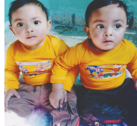
દેવ-દેવન દરજીભાઈ વાલેલા