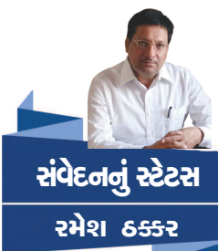
સંવેદનનું સ્ટેટસ રમેશ કક્કર

અમૃતસરમાં થયેલા જિવિયાંવાલા હત્યાકાંડની ઘટના (૭૦૦ ની હત્યા) કરતાં પણ વધુ ભયંકર અને નિર્લક્ષ હતી. દેશભક્ત એ શહીદોની યાદ માનગઢની ટેકરીઓમાં આજે પણ ગૂંજે છે. સામાજિક સ્વતંત્રતા માટે આજીવન ભેખધારી ગોવિંદગુરૂએ પોતાના હૃદયના ભાવો એક ગીતમાં વ્યક્ત કર્યા છે... આજે પણ એ એમના યાદકોમાં ગવાય છે. એ શૌર્યગીત લાંબું છે પણ એની એક ઝલક... વાગડમાં મારો જન્મ હે માળવામાં મારો જન્મ હે ભૂરાંટિયાં નહીં માનું રે... માનગઢમાં મારી ધૂણી હે ભૂરાંટિયાં નહીં માનું રે... આ શૌર્યગીત મેઘાણીની યાદ અપાવે એવું છે. એમાં ભીલી ભોલીની ભીનાશ છે. અહીં ભૂરાંટિયાં એટલે કે જૂલ્મી અંગ્રેજોને પડકાર છે. લોકોને આહવાન છે. મા ભાર માટેનો પ્રેમ છે. એમને અંગ્રેજ સરકાર દ્વારા કેદી બનાવવા હતા... આંદામાન નિકોબાર સુધીની કાળાપાણીની સજા એમણે ભોગવી હતી... છેવટે સરકારે એમની મહાનતાને પિછાણી હતી... કાંસીની સજામાંથી મુક્તિ પામી એ તિરથી થયા હતા. આદિવાસી સમાજના આ જયોતિર્ધરે અંતિમ યાસ વારસીમાં ૩૦-૨૦-૧૯૩૧ના રોજ જાલોદ તાલુકાના કંબોઈ ગામે લીધા. છેલ્લા વરસોમાં એ ઠક્કરબાપાની સાથે ભીલસેવામંડળમાં કામ કરતા હતા... માનગઢ એ ભવ્ય દેશપ્રેમ, ઉત્તમ માનવસેવા અને ભક્તિયોગના ભવ્ય વારસા સાથે પ્રવાસીઓ માટે પણ અદભૂત આકર્ષણો ધરાવતું એક મનભાવન તીર્થસ્થળ છે... મહીસાગરના મોતી જેવું આ સ્થળ ગુજરાતની ભવ્ય ગદ્યાનું એક અહિં જાણીતું પણ જાજરમાન પ્રકરણ છે.