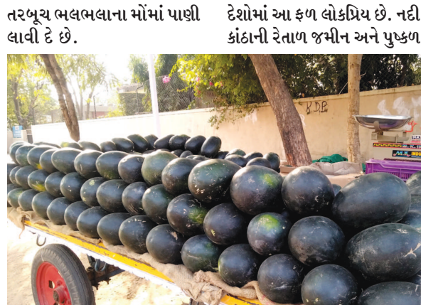
કલિંગર તરીકે પણ ઓળખાતા તરબૂચનું જન્મસ્થળ આફ્રિકા છે. પરંતુ જગતના બધા જ

તરબૂચના ટુકડા નાંખેલું શરબત હોય કે પછી મસાલો છાંટીને ટેસ્ટી બનાવેલી તરબૂચની કુટ ડીશ હોય ઉનાળાના દિવસોમાં તરસ્યા થયેલા રાહદારી માટે પોતાની તૃપ્તિ છિપાવવા માટેનું આ સરળ અને હાથવગું ખાદ્ય પદાર્થ છે. ઉનાળામાં વારંવાર તરસ લાગે છે અને પાણી પીવા છતાં તરસ મટતી નથી ત્યારે લાલ ગર્ભના તરબૂચને કાપી ખાવાથી તૃપ્તિ શમન થાય છે. ધ્યાનાકર્ષક લાલચટાક કલર, સાકર જેવો મીઠો-મધુરો સ્વાદ અને કાળજાળ ગરમીમાં કોઠાને ટાકક આપે તેવી શીતળતા ધરાવતું