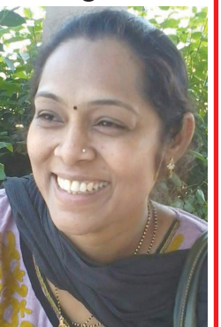
જ્યોતિકાબેન મીનેશભાઈ સોની આર્ટ્સ ટા. ધનસુરા