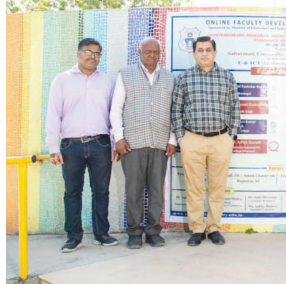
અલગ વિષય પર પ્રોગ્રામમાં ઉપસ્થિત ફેકલ્ટી મેમ્બર્સ સાથે ચર્ચા

IIT, NIT, IIM (જમ્મુ, બોમ્બે, ચેન્નાઈ, સિરમોર અને અમુતસર) ના તજજ્ઞો દ્વારા અલગ-