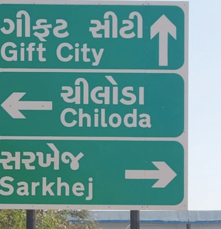
‘ગીફ્ટ સીટી’... ‘ગીફ્ટ સિટી’ લખાય