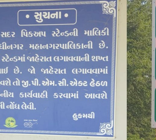
‘સુચના’... ‘સૂચના’ લખાય