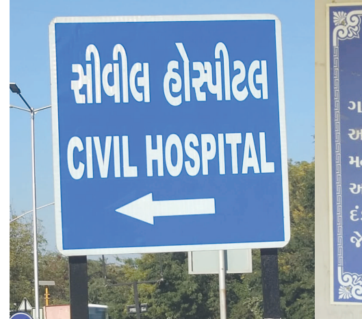
‘સીવીલ’... ‘સિવીલ’ લખાય