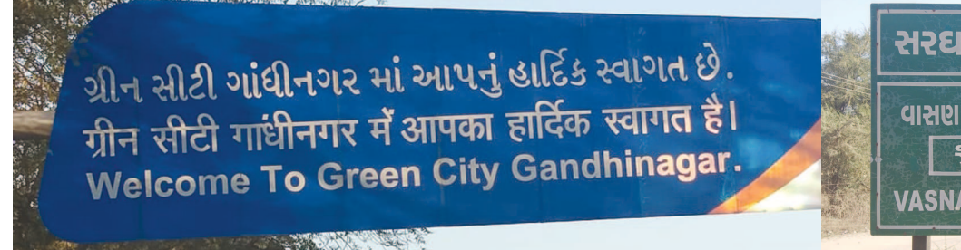
‘ગ્રીન સીટી’... ‘ગાંધીનગર માં’... ‘ગાંધીનગરમાં’ ભેગું લખાય ‘સરઘાસણ’... ‘સરગાસણ’... લખાય