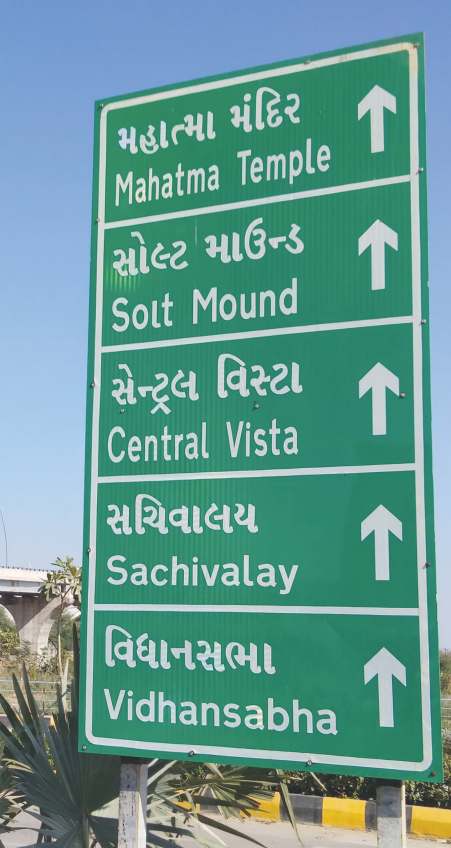
‘સોલ્ટ માઉન્ડ’... ‘સોલ્ટ માઉન્ટ’ લખાય