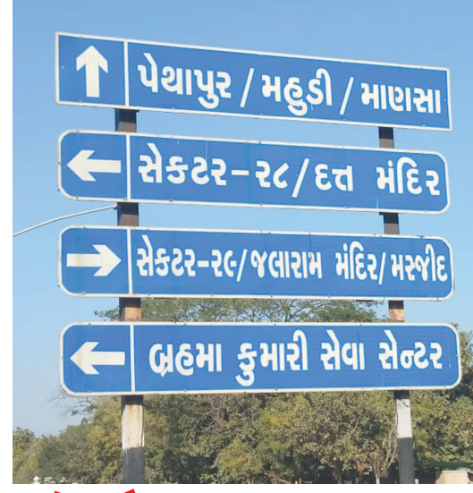
‘બ્રહ્મા કુમારી’... ‘બ્રહ્માકુમારી’ ભેગું લખાય ‘મસ્જુદ’... ‘મસ્જિદ’ લખાય

સાઈન બોર્ડ અંગે એક સર્વે કર્યો છે જે અનુસાર ગુજરાતના પાટનગર ગાંધીનગરમાં જ લગાડાયેલાં સાઈન બોર્ડમાં ગુજરાતી ભાષાની જોડણીની અદાબક ભૂલો જોવા મળી રહી છે. ગુજરાતી ભાષામાં તમામ બોર્ડ લખવાનો સરકારનો નિર્ણય આવકારદાયક છે પરંતુ આ નિર્ણયનું સાચી જોડણી સાથે અમલીકરણ થાય તે પણ એટલું જ જરૂરી છે.