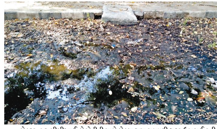
સેક્ટર-૧૨ સીબીઆઈ કોલોનીની સામે છેલ્લા ઘણા સમયથી ગટર ઉભરાઈ રહી છે. ગટરના પાણીથી અહીં ખાબોચિયા ભરાઈ ગયા છે. આ અંગે વરંવાર ફરિયાદ કરતાં આ સમસ્યાનો ઉકેલ આવતો નથી. ગટરો ઉભરાતા અહીં મચ્છરોનો ઉપદ્રવ વધ્યો છે.