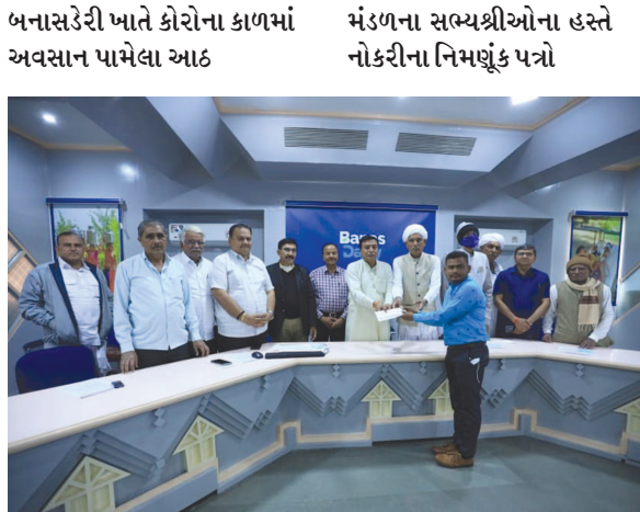
કર્મચારીના વારસદારને ચેરમેન શ્રી શંકરભાઈ ચૌધરી ના માર્ગદર્શન હેઠળ નિયામક

પાલનપુર, તા. ૩૦ કોરોના મહામારીએ સમગ્ર દેશ અને દુનિયામાં હાહાકાર મચાવીને કેટલાય પરિવારોમાં તબાહી મચાવી છે તે સંજોગોમાં બનાસડેરીના નિયામક મંડળે ખાસ કિસ્સા તરીકે નિર્ણય લઈને જે કર્મચારીનું કોરોના કાળમાં કોરોના બિમારીથી અવસાન થયુ હતુ તેમના પરિવારમાંથી તેના વારસદારને નોકરીમાં લઈને આપત્તિના સમયે પરિવારના વ્હારે આવી છે. આજે