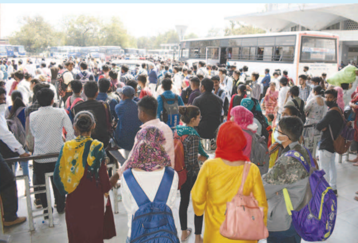
પીએસઆઈની લેખીત પરીક્ષાના ઉમેદવારો ગાંધીનગરમાં ઉમટી પડ્યા હતા. બહારગામના હજારો વિદ્યાર્થીઓ શહેરમાં આવતા એસ.ટી. કેપો પર ભારે ભીડ સર્જાઈ હતી. એસ.ટી. એ વધારાની બસોની વ્યવસ્થા ન કરતા મુસાફરો અટવાયા હતા. વ્યવસ્થા જાળવવા પોલીસની મદદ લેવી પડી હતી.