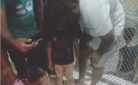
મહાશિવરાત્રી પર્વની ઉલ્લાસભર ઉજવણી કરી હતી. ત્યારબાદ તા. ૫ મી માર્ચના રોજ ચિલોડા સ્થિત નીલકંઠ મહાદેવ મંદિરમાં શિવના પ્રતિક નંદી (પોથિયો) દૂધ પીવે છે તેવા એક ભકતને વાત વહેતી મુકતાં મોડી રાત્રે લોકો દૂધ લઈને નંદીને પીવડાવવા દોડ્યા હતાં. અમુક લોકો દૂધ અને ચમચી સાથે દૂધ પીવડાવવા પ્રયાસ કર્યાં ત્યારે દૂધ પીવે છે તે સત્ય ઘટના અંગે લોકોએ સાચી હકીકત જાણવાનો પ્રયાસ કર્યો. ત્યારે લોકોમાં અનેક તર્કવિતર્કો થવા લાગ્યા હતા. આમ વા

ચિલોડા નીલકંઠ મહાદેવ મંદિરમાં નંદી દૂધ પીવે છે તેવા સમાચારથી મોડી રાત્રે લોકો જોવા ઉમટ્યાં