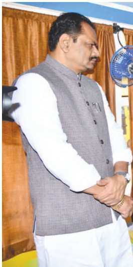
ભૂપેન્દ્ર પટેલે આ સમાજ હિતકારી પ્રોજેક્ટ માત્ર અમદાવાદ મહાનગર પુરતો સીમિત ન રહેતાં રાજ્યમાં વ્યાપક સ્તરે શરૂ થાય અને શિક્ષા-દિક્ષાથી વંચિત દરિદ્ર બાળકોને શિક્ષણ સંસ્કાર મળે તેવી સામૂહિક સમાજ જવાબદારીનું