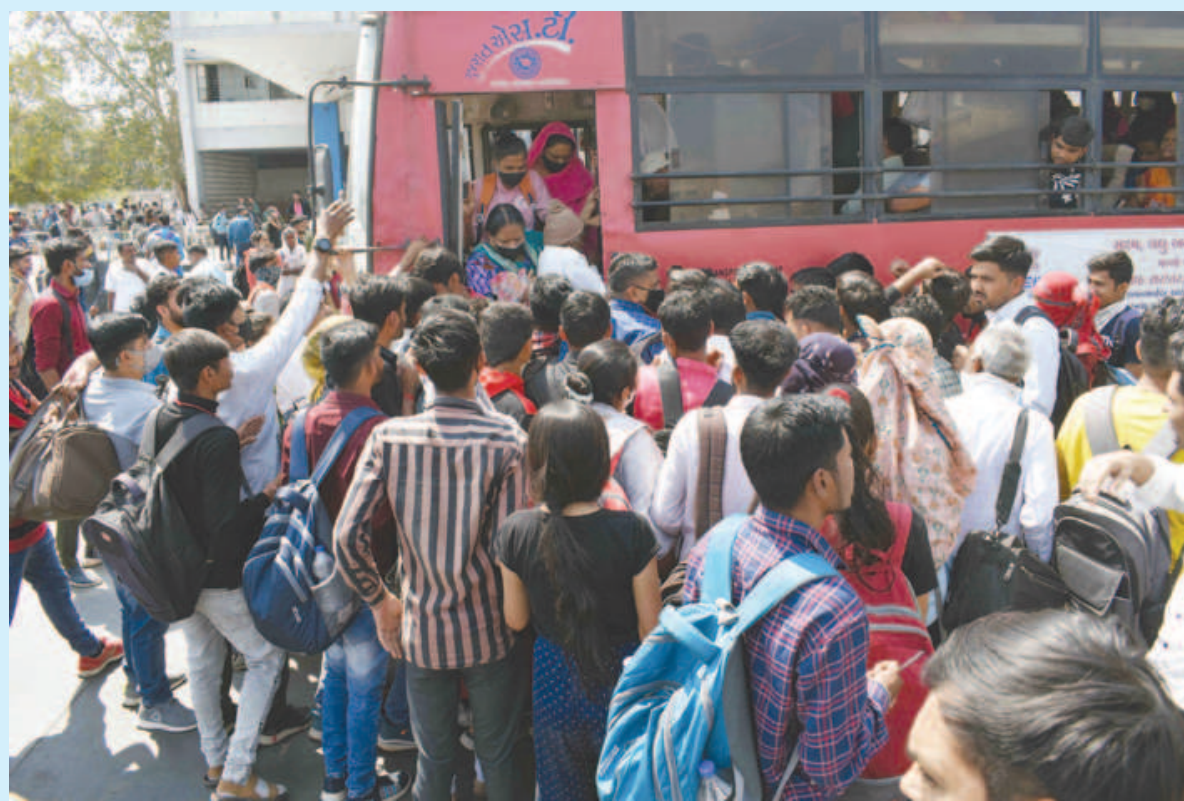
પીએસઆઈની લેખીત પરીક્ષાના ઉમેદવારો ગાંધીનગરમાં ઉમટી પડ્યા હતા. બહારગામના હજારો વિદ્યાર્થીઓ શહેરમાં આવતા એસ.ટી. કેપો પર ભારે ભીડ સર્જાઈ હતી. એસ.ટી. એ વધારાની બસોની વ્યવસ્થા ન કરતા મુસાફરો અટવાયા હતા. વ્યવસ્થા જાળવવા પોલીસની મદદ લેવી પડી હતી.