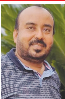
પરસોતમભાઈ પટેલ વ્યૂ ઇન્ડિયા ટાઇમ બાયડ જુલો અરવલ્લી