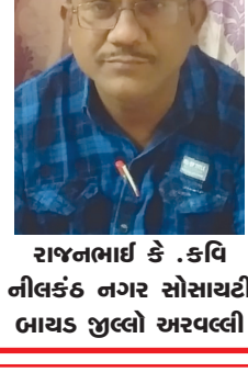
રાજનભાઈ કે.કવિ નીલકંઠ નગર સોસાયટી બાયડ જુલો અરવલ્લી