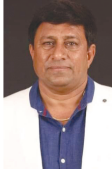
જગદીશભાઈ પટેલ વૃંદાવન સોસાયટી બાયડ જુલો અરવલ્લી