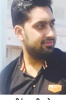
વીરંગ પી પટેલ સ્વામિનારાયણ સોસાયટી વિભાગ-૨ બાયડ જુલો અરવલ્લી