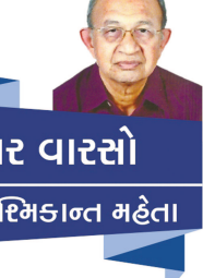
અમર વારસો ડૉ. રઘ્મિંકાન્ત મહેતા

પ્રગટાવો. હું પ્રહલાદને લઈને આમાં બેસી જાઉં છું.' હોલિકાએ આ ક્યું (૧) સાંજનો સમય નહિ રાત, નહિ દિવસ. (૨) અગ્નિનું સાધન - ન શસ્ત્ર, ન અસ્ત્ર; નહિ બિમારી. હોલિકા ચીતામાં બેસી ગઈ. પ્રહલાદને ખોળામાં લીધો. પ્રેમથી એને માથે હાથ પસવાયો. મનમાં વિષ્ણુ-સ્મરણ કર્યું. હિરણ્યકશિપુને કહ્યું, 'હવે મશાલથી ચીતાને પ્રજ્જ્વલિત કરો.' હિરણ્યકશિપુએ સળગતી મશાલ યાંપી. ભડભડાટ અગ્નિમાં હોલિકા બળી ગઈ. પ્રહલાદ હંધખેમ બચી ગયો. પ્રહલાદના તેજોવર્તુળ નીચે હોલિકાના આત્મસ્મરણનો વૃત્તાંત દેહાઈ ગયો. પરંતુ લોકોને યાદ આવ્યું. ફાગણની પૂનમે મંદિર પાસે અગ્નિ પ્રગટે, એ હોલી. એની પ્રદક્ષિણા કરતી વખતે બોલવાનું - હોલિકાએ નમઃ! હોલિકાને પ્રમાણ.