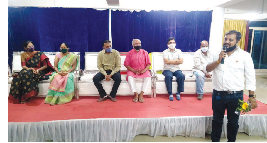
ગાંધીનગર કોર્પોરેશનની આગામી ચુંટણીમાં ટીકીટ મેળવનાર બ્રહ્મ સમાજના ઉમેદવારોનું સન્માન ગાંધીનગર બ્રહ્મ સમાજ દ્વારા કરવામાં આવ્યું હતું. કોરોનાની ગાઈડલાઈનનું પાલન કરી સોશિયલ ડિસ્ટન્સ સાથે કાર્યક્રમનું આયોજન કરવામાં આવ્યું હતું.

હોદ્દેદારોએ રજૂઆત કરી હતી જેને લીગલ સમિતિએ બંને પક્ષોને સાંભળ્યા બાદ તા. ૨૩મી માર્ચે યુકાદો આપીને બગીચામાં યોજાયેલી બેઠક તથા હોદ્દેદારોની નિમણૂકને ગેરકાયદેસર ઠેરવી હતી. આ સાથે તેમણે ગેરકાયદેસર મંડળી બનાવી રચવામાં આવેલી કારોબારી સમિતિ તથા હોદ્દેદારોના સભ્યો રેડકોસ સોસાયટીના સત્તાવાર સભ્યો નથી તેથી તેઓ બેઠક ખોલાવી શકે નહીં કે હોદા ધારણ કરી શકે નહીં તેવું જણાવ્યું છે.