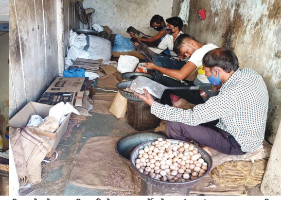
લોકડાઉનની અકવાઓના પગલે જરૂરીયાતની ચીજવસ્તુ એકત્ર કરવાની જાણે હોડ લાગી ગઈ છે. ગયા વર્ષે લોકડાઉનમાં પાન-મસાલાની ભારે ખેંચ અનુભવાઈ હતી. લોકડાઉનની અકવા હેલાતા જ પાનના ગલ્લાવાળાઓ હોલસેલાના વેપારીઓને ત્યાં ઉમટી પડયા હતા. પાન-મસાલાનો સ્ટોક કરી લેવા વેપારીઓ ઉમટી પડયા હતા.