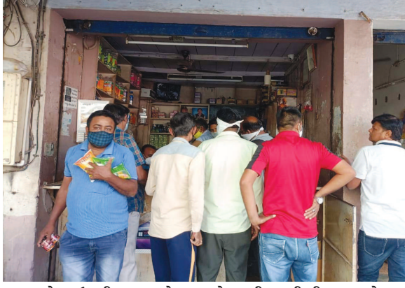
લોકડાઉનની અકવાઓના પગલે જરૂરીયાતની ચીજવસ્તુ એકત્ર કરવાની જાણે હોડ લાગી ગઈ છે. ગયા વર્ષે લોકડાઉનમાં પાન-મસાલાની ભારે ખેંચ અનુભવાઈ હતી. લોકડાઉનની અકવા હેલાતા જ પાનના ગલ્લાવાળાઓ હોલસેલાના વેપારીઓને ત્યાં ઉમટી પડયા હતા. પાન-મસાલાનો સ્ટોક કરી લેવા વેપારીઓ ઉમટી પડયા હતા.