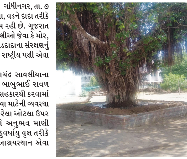
ગાંધીનગર, તા. ૭ ઓળખવાની પ્રેમભરી સૂચક પરંપરા ચાલી આવી છે અને હજુ અકબંધ રહી છે. ગૂજરાત વિદ્યાપીઠ સંચાલિત મહાદેવ દેસાઈ ગ્રામસેવા સંકુલ-સાદરામાં અનેક પક્ષીઓ જેવા કે મોર, ચકલી, ઘુવડ, કબુતર, બગલાં તેમજ વાંદરાઓના આશ્રય સ્થાન એવા વડદાદાના સંરક્ષણનું કામ હાથ ધરાયુ. આજે પણ અનેક પક્ષીઓ સાથે સાથે ૧૫૦૦ થી વધુ રાષ્ટ્રીય પક્ષી એવા મોરનું આશ્રયસ્થાન આ વડદાદા બની રહ્યા છે.