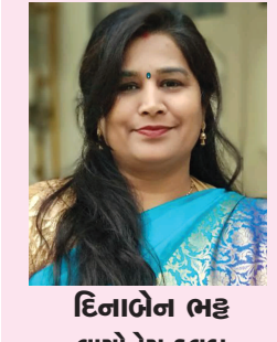
દિનાબેન ભટ્ટ લાયોનેસ ક્લબ