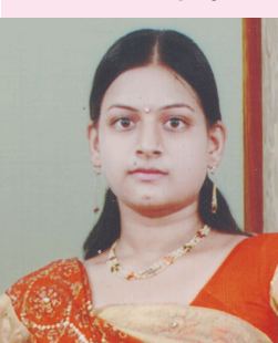
સોલંકી ફાલ્ગુબેન ડી