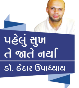
પહેલું સુખ તે જાતે નર્વા ડૉ. કેદાર ઉપાદ્યાય

અત્યારે ચોમાસાની સીઝન. હાલ કોરોના થોડો કાબૂમાં છે, પણ ચોમાસાને કારણે થતા બીજા રોગો જેવાકે મલેરિયા, ટાઈફોઈડ, ડેન્ગ્યુ, અને ચિકનગુન્યા એ માથું ઉચક્યું છે. અગાઉ લેખોમાં આપણે ટાઈફોઈડ અને ડેન્ગ્યુ વિષે વિગતે જણ્યું. આજે આપણે ચિકનગુન્યા વિષે જણીએ. ચિકનગુન્યા સૌપ્રથમ આફ્રિકામાં જોવા મળ્યો અને પછી ધીમે ધીમે લગભગ દરેક દેશમાં ફેલાયો. ચિકનગુન્યા વાઈરસથી થતો રોગ છે. ચિકનગુન્યાનો ફેલાવો મચ્છર કરડવાથી થાય છે. ચિકનગુન્યા ચેપી નથી. એટલેકે એક માણસથી બીજા માણસમાં સંક્રમિત થતો નથી. ચિકનગુન્યા એ મચ્છર કરડવાના ૩ થી ૭ દિવસમાં પોતાના લક્ષણો બતાવે છે. ચિકનગુન્યાના લક્ષણો જોઈએ તો તાવ, સાંધાનો ખૂબ દુખાવો, માથું દુખવું, ચામડીમાં ચકામાં પડવા વગેરે છે. આ લક્ષણો સામાન્ય રીતે ૭ થી ૧૫ દિવસ સુધી રહે છે. અમુક લોકોને સાંધાનો દુખાવો મહિનાઓ કે વર્ષો સુધી પણ રહે છે. આ રોગ મારક નથી પણ હેરાન ખૂબ કરે છે. ચિકનગુન્યાની વેક્સીન હજુ શોધાઈ નથી. ચિકનગુન્યાનો વાઈરસ શરીરને થોડા સમય સુધી જ ઈનફેક્ટ કરે તે માત્રક નથી