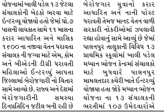
૧૩ ૧૪૪૫ માટે ૧૦૦ અરજીઓ આવી પાલનપુર તાલુકાની વિવિધ ૧૩ સ્કૂલોમાં ખાલી પડેલ મધ્યાલ ભોજન કેન્દ્રના સંચાલકોની ભરતી યોજવામાં આવી હતી જેમાં ૧૧ માસના કરાર અને ૧૬૦૦ ના માસિક માનદ વેતન વાળી આ પોસ્ટ માટે ઉચ્ચ શિક્ષણ મેળવનારા ૧૦૭ શિક્ષિત મહિલાઓએ અરજી કરી હતી. અમે માસિક ૧૬૦૦ ના માનદ વેતન વાળી મધ્યાલ ભોજન સંચાલકની જગ્યા માટે ઉચ્ચ શિક્ષણ મેળવનાર બેરોજગારો ઈન્ટરવ્યુમાં આવતા જિલ્લામાં બેરોજગારી શિક્ષિત યુવાનોને માટે શ્રાપ સમાન પુરવાર થતી જોકે મળી હતી.

અરજીઓ કરી હતી જોકે આ ભરતીમાં સ્થાનિક તેમજ વિદ્યવા મહિલા માટે ધો. ૭ તેમજ ૧૦ પાસની લાયકાત સામે આ ભરતીમાં શિક્ષક સમકક્ષ એમ.કોમ અને બીએડ કરેલ મહિલાઓ ઈન્ટરવ્યુ આપવા ઉમટી. પડી હતી જોકે ૧૧ માસ ના કરાર આધારીત