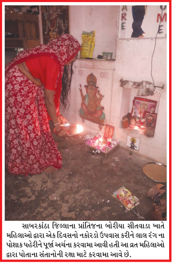
સાબરકાંઠા જિલ્લાના પ્રાંતિજના ભોરીયા સીતવાડા ખાતે મહિલાઓ દ્વારા એક દિવસનો નકોરડો ઉપવાસ કરીને લાલ રંગ ના પોશાક પહેરીને પૂર્ણ અર્ચના કરવામા આવી હતી આ વ્રત મહિલાઓ દ્વારા પોતાના સંતાનોની રક્ષા માટે કરવામા આવે છે.

સાયન્સ દ્વારા ડોક્ટર વિક્રમ સારાભાઈ ના ૧૦૨ માં જન્મદિવસ અંતરીક્ષ-૨૦૨૧ ના ઉજવણી કરવામાં આવી હતી. જેમાં વિવિધ યુનિવર્સિટી કોલેજ અને શાળાના ૨૩૫ વિદ્યાર્થીઓએ રંગોળી, ઓન ડ્રાઇનગ, પોસ્ટર પ્રેઝન્ટેશન, ક્વિઝ, પેરાશૂટ ડ્રાઇવ, બલુન કાર રેસ, પ્રેશર રોકેટ રેસ અને સ્પેસ વીકલ મોડેલ જેવી વિવિધ સ્પર્ધાઓમાં ભાગ લીધો હતો. કાર્યક્રમમાં ડો. ડી એસ મુંજાલ સિનિયર સાઈન્ટિસ્ટ ઈસરો એ હાજરી આપીને વિદ્યાર્થીઓને અવકાશ વિષે પ્રો. યા-સેલર ડો. મહેન્દ્ર શર્મા ફાઈનલ ફેકલ્ટી ડો. એસ એસ પંચોલી રિસર્ચ ડાયરેક્ટર ડો. અજય ગુપ્તા અને ફેકલ્ટી ઓફ સાયન્સના ડીન ડો. અમિત પરીખ ઉપસ્થિત રહીને વિજેતા વિદ્યાર્થીઓને ઈનામ આપીને પ્રોત્સાહિત કર્યા હતા.