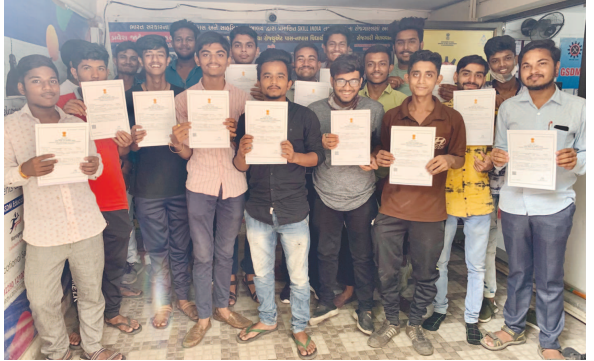
જુએસકીએમનો ૧૨મો વાર્ષિક પ્રમાણપત્ર વિતરણ કાર્યક્રમ

સરકાર દ્વારા જે સતત ચીજવસ્તુઓમાં અને પેટ્રોલ-ડીઝલમાં ભાવ વધારો થઈ રહ્યો છે તેને ઓછો કરવામાં આવે નહિતર આવનારા સમયમાં તેનો જવાબ આપવાની વિશ્વાસભરીમ બાળ વિકાસ મંત્રાલય દ્વારા રાષ્ટ્રીય પોષણ માસ અંતર્ગત સ્ટેચ્યુ ઓફ યુનિટી, કેવડિયા-નર્મદા ખાતે દેશના વિવિધ રાજ્યો-કેન્દ્રશાસિત પ્રદેશો વચ્ચે આગામી તા. ૩૦ તથા ૩૧ ઓગસ્ટ-૨૦૨૧, બે દિવસીય રાષ્ટ્રીય કોન્ફરન્સનું આયોજન કરાયું છે. આ કોન્ફરન્સમાં રાજ્યોના મહિલા અને બાળ વિકાસ