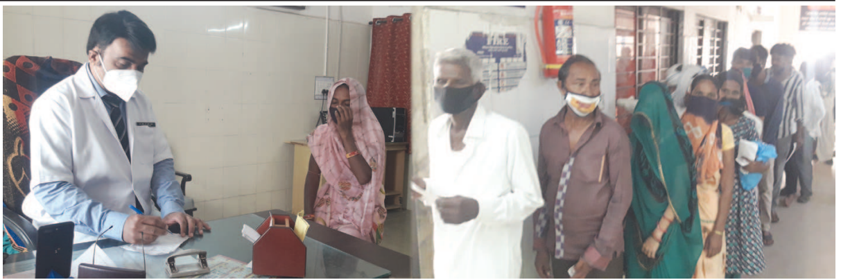
ડીસાની સિવિલ હોસ્પિટલ તાવ-શરદીના દર્દીઓથી ઉભરાઈ ઉઠી