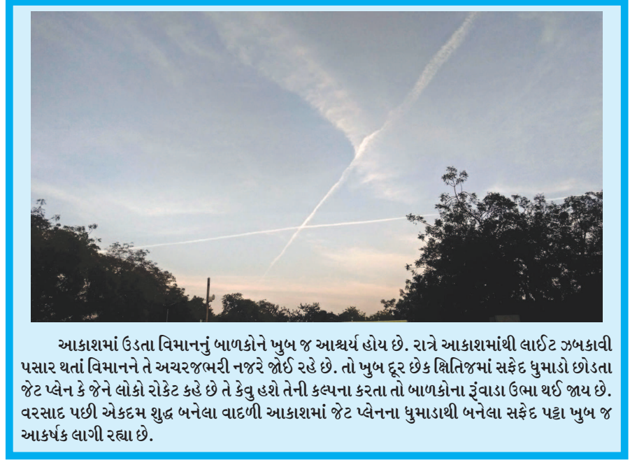
આકાશમાં ઉડતા વિમાનનું બાળકોને ખુબ જ આશ્ચર્ય હોય છે. રાત્રે આકાશમાંથી લાઈટ ઝબકાવી પસાર થતાં વિમાનને તે અચરજભરી નજરે જોઈ રહે છે. તો ખુબ દૂર છેક ક્ષિતિજમાં સફેદ ધુમાડો છોડતા જેટ પ્લેન કે જેને લોકો રોકેટ કહે છે તે કેટલું ઊંચે તેની કલ્પના કરતા તો બાળકોના રૂંવાડા ઉભા થઈ જાય છે. વરસાદ પછી એકદમ શુદ્ધ બનેલા વાદળી આકાશમાં જેટ પ્લેનના ધુમાડાથી બનેલા સફેદ પટ્ટા ખુબ જ આકર્ષક લાગી રહ્યા છે.