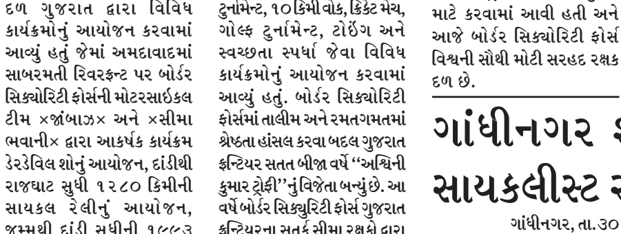
ગાંધીનગર દ્વારા વિવિધ કાર્યક્રમોનું આયોજન કરવામાં આવ્યું હતું જેમાં અમદાવાદમાં સાબરમતી રિવરફ્રન્ટ પર બોર્ડર સિક્યોરિટી ફોર્સની મોટરસાઈકલ ટીમ xજાંબાજx અને xસીમા ભવાનીx દ્વારા આકર્ષક કાર્યક્રમ ડેરડેવિલ શોનું આયોજન, દાંડીથી રાજધાન સુધી ૧૨૮૦ કિમીની સાયકલ રેલીનું આયોજન, જમ્મુથી દાંડી સુધીની ૧૯૮૩

ગાંધીનગર તા. ૩૦ આ વર્ષે આઝાદીની ૭૫મી વર્ષગાંઠ નિમિત્તે દેશભરમાં xઆઝાદી કા અમૃત મહોત્સવx ઉજવવામાં આવી રહ્યો છે. આ મહોત્સવ અંતર્ગત સીમા સુરક્ષા કિમી સાયકલોથોનનું આયોજન અને રાયથાણવાલા (રાજસ્થાન) થી કેવડિયા (ગુજરાત) સુધીની ૭૨૩ કિમીની સાયકલ રેલીનો સમાવેશ થાય છે.