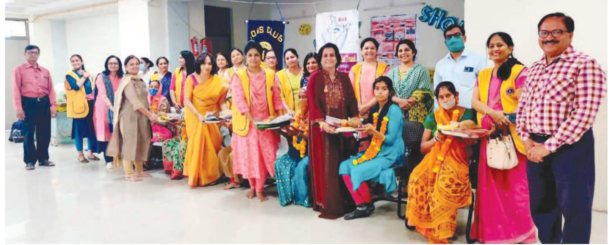
અયચાર્ણવીગ્રસ્ત ગર્ભવતી મહિલાઓની ગોદ ભરાઈ વિશ્વ એઈડ્સ દિન પૂર્વે ગાંધીનગર સિવિલ હોસ્પિટલ ખાતેના એઆરટી સેન્ટર દ્વારા ભારતીય એજ્યુકેશન ટ્રસ્ટ અને જીએસએનપી પ્લસના સંયુક્ત ઉપક્રમે આયોજિત કાર્યક્રમમાં શહેરની સેવાભાવી સંસ્થા લાયન્સ કલબ ઓફ ગાંધીનગર ફેમિના દ્વારા સાત અયચાર્ણવી ગ્રસ્ત ગર્ભવતી મહિલાઓની ગોદ ભરાઈ કરવામાં આવી હતી. અત્રે ઉલ્લેખનીય છે કે સાતેય મહિલાઓની પ્રથમ વખત લોહીની તપાસ દ્વારા તેમને અયચાર્ણવીથી પ્રભાવિત હોવાનું જાહેર કરાયું હતું.