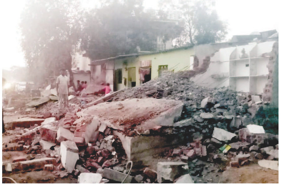
વાયબ્રન્ટ સમિટ આવતા દબાણો હટાવવાની કામગીરી શરૂ કરાઈ છે. ગીકેટ સીટી જતાં માર્ગને પણ પહોળો કરવામાં આવી રહ્યો છે. ધોળાકુવા નજીક અડચણ રૂપ દબાણો અને દુકાનોની આગળના શેડના દબાણોને દૂર કરવામાં આવ્યા હતા.

કેસ કેસ મળ્યો છે. કેનેડા ખાતે સ્થિર થયેલ મહિલા દિપાવલી પર્વમાં ગુજરાત આવી હતી. અહિં આવ્યા પછી તેણીએ ચાર ધામની યાત્રા કરી હતી. છેલ્લે તેણીનીએ જગન્નાથ પુરીની મુલાકાત પણ લીધી હોવાનું જાણવા મળેલ છે. મળતી વિગતો પ્રમાણે આ મહિલા દર્દીએ વેકિસનેશન બંધ લીધેલા છે. જો કે કેનેડા પરત જવાનું હોવાથી આર.ટી.પી.સી.આર. ટેસ્ટ કરજીયાત હોવાથી ટેસ્ટ કરાવતાં તેણીનીનો રિપોર્ટ પોઝીટીવ આવ્યો છે. તેણીનીને કોઈપણ લક્ષણો કોરોનાના દેખાયા નથી. શહેરમાં વસ્તુ જતા કેસોને લઈ તંત્રની ચિંતા વધી છે. લોકોની બેફિકરઈ ક્રેવિડ ગાર્ડના પાલન માટે છેલ્લી તંત્રએ હવે સોશયલ ડિસ્ટન્સીંગ જાળવવા તેમજ ફરજિયાત માસ્કના નિયમની અમલવારી માટે સૂચનો જાહેરી કરી છે. શહેરમાં મોટાભાગના એક્ટીવ કેસો હોમ આઈસોલેશનમાં સારવાર હેઠળ હોવાથી હોમ આઈસોલેશનના