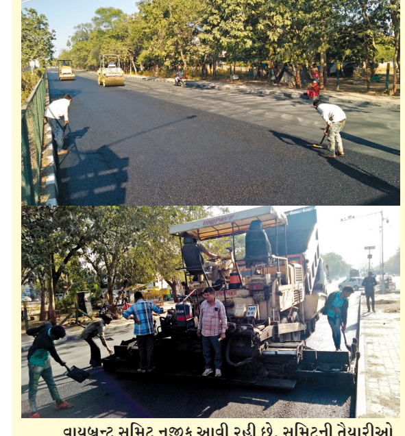
વાયબ્રન્ટ સમિતિ નજીક આવી રહી છે. સમિતિની તૈયારીઓ પૂરજોશમાં ચાલી રહી છે. શહેરના માર્ગોનુ નવીનીકરણ ખૂબ ઝડપથી થઈ રહ્યુ છે. ઘ-૩ થી ઘ-૨ ની વચ્ચેના રોડની કામગીરી હાલમાં ચાલી રહી છે. જેના કારણે ટ્રાફિકને ડાયવર્ઝન અપાયુ છે.

ગાંધીનગરમાં જાહેરાત માટેનું અસરકારક માધ્યમ ગાંધીનગરસમાચાર ફોન - ૨૩૨૨૨૫૭૧, ૨૩૨૩૭૫૭૧