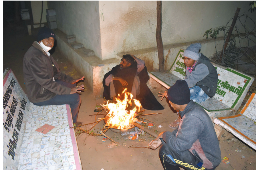
સવારે સુપ્રાઈઝ થયા બાદ મોડે સુધી સેક્ટરવાસીઓ ઘરની બહાર ડીકીયુ કરતા નથી જ્યારે સાંજના આજે પણ લઘુત્તમ તાપમાન ૬.૫ ડીગ્રીએ જ રહેતા સમગ્ર શહેર ક્રાંતિલ ઠંડીમાં ઠુંંધવાઈ રહ્યું છે. જો

દિવસથી ઠંડીએ કડકો બોલાવતા નગરજનો ઘરમાં પુરાઈ ગયા છે. દિવસ રાત ઠંડીની અસરથી બચવા માટે શહેરીજનો સ્વેટર, ટોપીમાં સજજ જોવા મળે છે. ત્રણ દિવસ અગાઉ લઘુત્તમ તાપમાનમાં એકાએક ગિરાવટ આવતા લઘુત્તમ તાપમાન ૧૪ થી નીચે ઉતરીને સીધુ ૧૧ ડીગ્રીએ આવી ગયું હતું. ત્યારબાદ ઠંડીનો પારો ૩ ડીગ્રી વધુ ઉંચકાયો હતો જ્યારે લઘુત્તમ તાપમાન ૮ ડીગ્રીએ આવી ગયું હતું. બે દિવસ સુધી ઠંડીનો મિજાજ યથાવત રહ્યો હતો. જ્યારે ગઈકાલે શિયાળાની મોસમ વધુ આકરી પુરવાર થઈ હતી. લઘુત્તમ તાપમાન ૬.૫ ડીગ્રી પહોંચી જતા સિઝનની રેકર્ડ બ્રેક ઠંડી નોંધાઈ હતી જ્યારે છેલ્લા ૮ વર્ષમાં સિઝનની સૌથી વધુ ઠંડી નોંધાઈ હતી. ઠંડીએ હદ વટાવતા સૌ કોઈ કોલ્ડવેવથી પ્રભાવિત છે. વડીલો અને બાળકો ઠંડીથી વધુ પ્રભાવિત