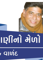
લાગણીનો મેળો રસિક વાળંદ