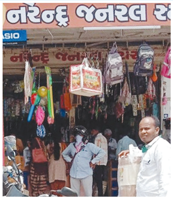
ત્યારબાદ ઓનલાઈન શિક્ષણથી અભ્યાસક્રમ શરૂ થયા. સમગ્ર વર્ષ દરમ્યાન શાળાઓમાં શિક્ષણ કાર્ય શક્ય ન બન્યું અને છેવટે ધો. ૧

બાયડ (બ્યુરો ઓફિસ) તા.૦૨ રાજ્યની શાળાઓમાં નવા શૈક્ષણિક સત્રનો પ્રારંભ થયાના ૨૪ દિવસ પછી પ્રથમ વખત સાબરકાંઠા, અરવલ્લીના સ્ટેશનરી બજારમાં ઘરાકી દેખાઈ. છેલ્લા ૧૫ મહિનાથી ધંધા વગર નવરા બેસી રહેતા દુકાનદારો ઘરાકીથી હરખાયા છે. પાઠ્યપુસ્તક, નોટબુક, દફતર, પાટીપેન ખરીદવા ભીડ જોવા મળી. તાજેતરમાં જ ધો. ૧૦ બોર્ડનું પરિણામ જાહેર થયું અને મુખ ઓછા સમયમાં શાળાઓમાં શિક્ષણ કાર્ય શરૂ થયું તેવી અપેક્ષાથી સ્ટેશનરી બજારમાં ભીડ જોવા મળી છે.