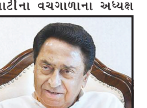
સોનિયા ગાંધીને સ્થાયી અધ્યક્ષ બનાવવામાં આવી શકે છે. અત્રે જણાવવાનું કે આ અગાઉ ચૂંટણી રણનીતિકાર પ્રશાંત કિશોરે મંગળવારે દિલ્હીમાં કોંગ્રેસ નેતા સોનિયા ગાંધી, રાહુલ ગાંધી અને પ્રિયંકા ગાંધીની મુલાકાત કરી હતી.

નવી દિલ્હી, તા. ૧૪ વર્ષ ૨૦૨૪માં થનારી લોકસભા ચૂંટણી પહેલા કોંગ્રેસ પાર્ટીમાં મોટા ફેરફારની તૈયારી ચાલી રહી છે. કોંગ્રેસના વચગાળાના અધ્યક્ષ સોનિયા ગાંધીએ પાર્ટીના સંસદીય રણનીતિક સમૂહની એક બેઠક બોલાવી છે. જેમાં અનેક મહત્વના નિર્ણયો લેવાઈ શકે છે. સૂત્રોનું માનીએ તો મધ્ય પ્રદેશના પૂર્વ મુખ્યમંત્રી અને ડિગ્ગજ નેતા કમલનાથને મોટી જવાબદારી સોંપાઈ શકે છે અને તેમને કોંગ્રેસ પાર્ટીના કાર્યકારી અધ્યક્ષ બનાવવામાં આવી શકે છે. અત્રે જણાવવાનું કે વર્ષ ૨૦૧૯ની લોકસભા ચૂંટણીમાં હાર બાદ રાહુલ ગાંધીએ પાર્ટી અધ્યક્ષ પદ છોડ્યું હતું અને ત્યારબાદ સોનિયા ગાંધી