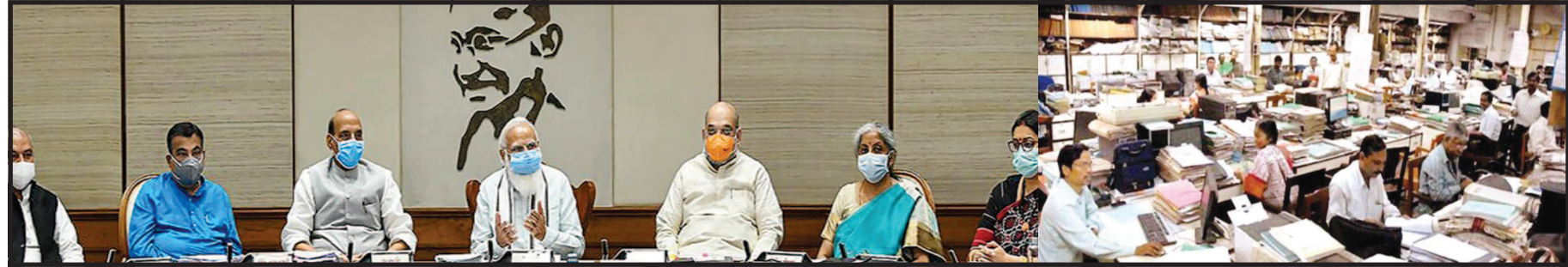
પેન્શનર્સના મોંઘવારી ભથ્થા પર રોક લગાવી હતી. હવે ૧ જુલાઈથી

કેન્દ્રીય કર્મચોરીઓને હાલ ૧૭ ટકા ડીએ મળે છે. પરંતુ, પાછલા ત્રણ હપ્તાને જોડીને હવે ૨૮ ટકા થઈ જશે. જાન્યુઆરી ૨૦૨૦માં ડીએ ૪ ટકા વધ્યું હતું, પછી જૂન ૨૦૨૦માં ૩ ટકા વધ્યું અને જાન્યુઆરી ૨૦૨૧માં ૪ ટકા વધ્યું છે. હવે આ ત્રણેય હપ્તાની ચુકવણી કરવામાં આવશે. ગયા વર્ષે કેન્દ્રીય મંત્રી કેબિનેટે સરકારી કર્મચોરીઓ માટે ડીએમાં વધારો કરવાનું એલાન કર્યું હતું, પરંતુ કોવિડ-૧૯ના કારણે તેના પર રોક લગાવવામાં આવી હતી.