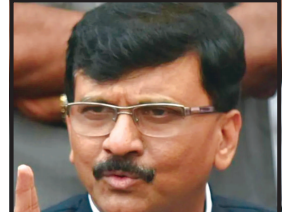
કે, જ્યાં સુધી વિપક્ષ પાસે પીએમ મોદીનો સામનો કરવા માટે કોઈ

લખનૌ, તા. ૧૪ ઉત્તર ભારતમાં શ્રાવણ મહિનામાં યોજાતી કાવડ યાત્રાનું આગવું મહત્વ છે. આ વર્ષે કોરોનાની વચ્ચે યુપી સરકારે કાવડ યાત્રાને મંજૂરી આપ્યા બાદ સુપ્રીમ કોર્ટે હવે કેન્દ્ર સરકાર અને યુપી સરકારને નોટિસ મોકલી છે. શુક્રવારે આ મામલાની સુનાવણી થશે. દરમિયાન સુપ્રીમ કોર્ટે પીએમ નરેન્દ્ર મોદીએ આપેલી ચેતવણીનો પણ ઉલ્લેખ કરીને કહ્યું છે કે, બુદ્ધ વડાપ્રધાનનું પણ માનવું છે કે, પરિસ્થિતિમાં ટીલ મુકાય તેમ નથી. સુપ્રીમ કોર્ટે બુધવારે સવારે જાને જ આ મામલામાં યુપી સરકારને નોટિસ આપી હતી અને કહ્યું હતું કે, ૨૫ જુલાઈથી ૬ ઓગસ્ટ સુધી કાવડ યાત્રા યોજવાની છે અને જ્યારે પીએમ પોતે કહી રહ્યા છે કે, કોરોનાની ત્રીજી લહેરને આપણે રોકવી પડશે અને જરા પણ બેદરકારી પાલવે તેવી નથી. સુપ્રીમ કોર્ટે આ સંદર્ભમાં યુપી સરકારને શુક્રવારે જવાબ આપવા માટે કહ્યું છે. દરમિયાન ઉત્તરાખંડ સરકારે કાવડયાત્રા રદ કરવાની જાહેરાત કરી દીધી છે. સીએમ પુષ્કરસિંહ ધામીએ કહ્યું હતું કે, રાજ્યમાં કોરોનાનો નવો વેરિએન્ટ સામે આવ્યો છે ત્યારે લોકોની જીંદગી સાથે રમત કરવી યોગ્ય નથી. સરકાર કોઈ ચાન્સ લેવા માંગતી નથી. જોકે યુપીમાં કોરોના પ્રોટોકોલ સાથે કાવડયાત્રાના આયોજનની તૈયારીઓ શરૂ થઈ ગઈ છે.