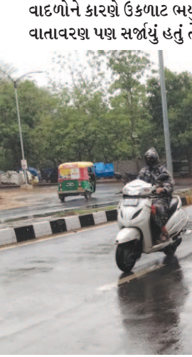
છતાં બપોરના સમયે ક્યાંક ક્યાંક છુટા છવાયા છાંટા