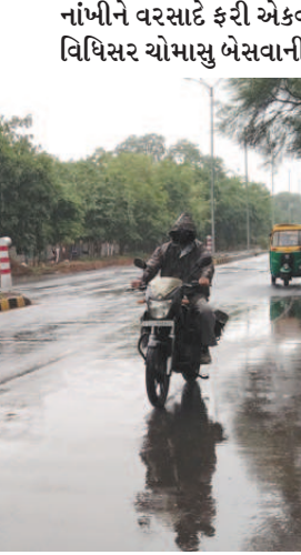
આશાઓને ઠગારી બનાવી હતી. જોકે ક્યાંક ક્યાંક હળવા

વરસાદને કારણે શહેરના વાતાવરણમાં બપોર પછી ઠંડક પ્રસરવા પામી હતી અને સમગ્ર શહેરનો માહોલ હિલસ્ટેશન જેવો થઈ જવા પામ્યો હતો. સાંજના સમયે અનેક શહેરીજનોએ પોતાના મકાનોના ધાબે ચડી અને ગોરંભાયેલા વાદળોની અવનવી આકૃતિઓ નિહાળી તેની તરતરીતે લીધી હતી અને સોશિયલ મીડિયા પર શેર કરી હતી. વારંવાર હાથતાળી દઈ રહેલા વરસાદથી અકબચાવા નાગરિકો હવે શહેરમાં મુશળધાર વરસાદ સાથે ચોમાસાનો ધમાકેદાર પ્રારંભ થાય તેવી ભવેના કરી રહ્યાં છે.