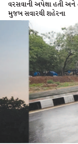
આકાશમાં વાદળો ઘેરાતાં આ અપેક્ષા વધુ મજબુત બની હતી.