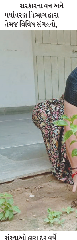
સંસ્થાઓ દ્વારા દર વર્ષે લાખો વૃક્ષો રોપવામાં આવે