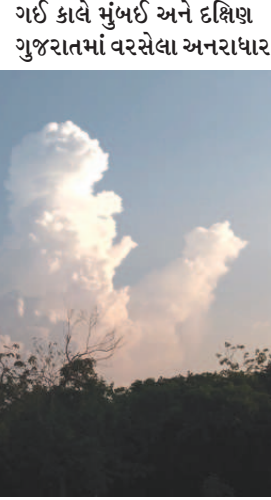
વરસાદને કારણે શહેરીજનોને આજે ધોધમાર વરસાદ