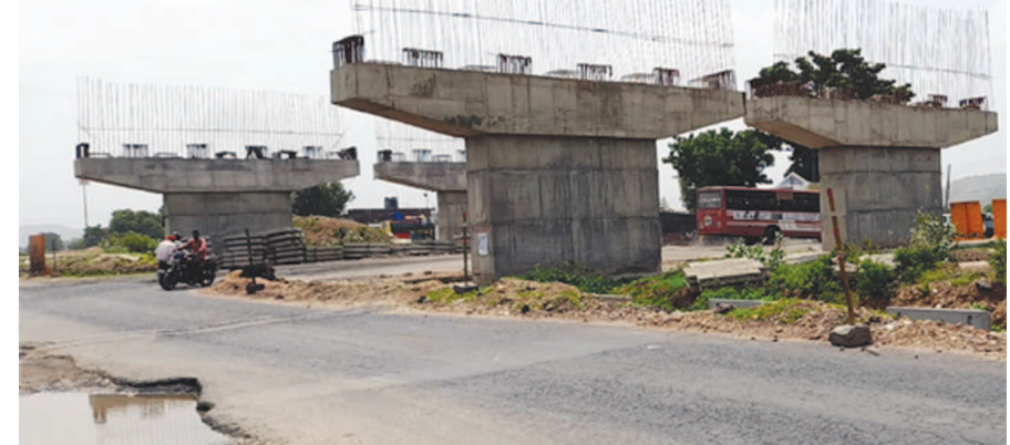
હિંમતનગર-શામળાજી હાઈવેનું કામ છેલ્લા કેટલાક સમયથી બંધ થતાં વાહન ચાલકો અનેક મુશ્કેલીઓ અનુભવી રહ્યા છે. હવે વરસાદની પધરામણી થઈ છે ત્યારે હાઈવે ઉપર આડેઘડ તૈયાર કરાયેલાં ડાયવર્ઝન અને રોડ ઉપર વરસાદી પાણીના ભરાવાના કારણે ગમખવાર અકસ્માતની ભીતી વ્યક્ત થઈ છે. રાજેન્દ્રનગર ચોકડી ઉપર સ્થાન ઉભા કર્યા પછી કામ કરનાર એજન્સી અદ્રશ્ય થઈ જતાં સ્થાનિક વાહન ચાલકો અને વેપારીઓ હાલાકીનો સામનો કરી રહ્યા છે.

નવીનીકરણ યાતનારૂપ બની ગયું છે. યોગ્ય રીતે ડાયવર્ઝન અપાયો નથી જેના કારણે ખેડૂતોને ગાડાં તેમજ ટ્રેક્ટર લઈ ખેતરમાં જવું હોય તો ચોમાસાની સીઝનમાં અને તેમાંથી દીશા સુચક બોર્ડ વગર ડાયવર્ઝન આપી દેવાયાં છે જેના કારણે રાત્રે ગમખવાર અકસ્માતની સંભાવના વધી છે. છેલ્લા ૨ દિવસથી વરસાદની પધરામણી હાઈવેના બંધ કામથી વધી છે. ચોમાસા શરૂ થતાં અન્ય બાંધકામ સાઈટો ઠપ્પ થઈ છે ત્યારે હાઈવેનું નવનિર્માણ કામ વધુ ધીમમાં પડી શકે છે.