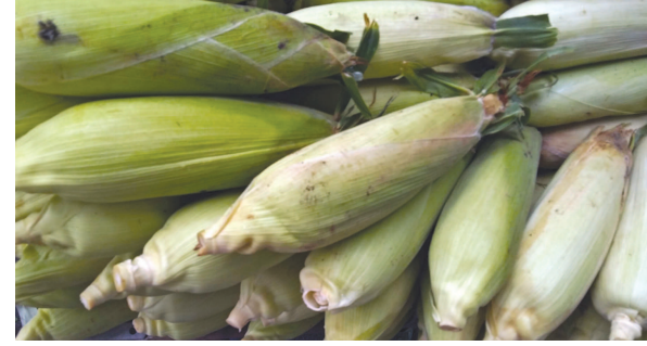
વાવેતર કરતા હોય છે. ખેતીની સીઝનમાં પાક

ઘરમાં ઉપયોગ થાય તે માટે મકાઈ અને બાજરીનું અવશ્ય ઉત્પાદન બજારમાં વેચવાને બદલે ઘરના સભ્યો મકાઈ-બાજરીનો રોટલો આરોગી શકે અને બાકી વધે તે ઉપજ