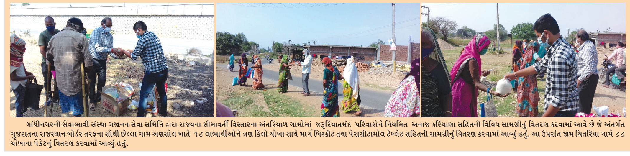
ગાંધીનગરની સેવાભાવી સંસ્થા ગજાન સેવા સમિતિ દ્વારા રાજ્યના સીમાવર્તી વિસ્તારના અંતરિયાળ ગામોમાં જરૂરિયાતમંદ પરિવારોને નિયમિત અનાજ કરિયાણા સહિતની વિવિધ સામગ્રીનું વિતરણ કરવામાં આવે છે જે અંતર્ગત ગુજરાતના રાજસ્થાન બોર્ડર તરફના સૌથી છેલ્લા ગામ અણસાલ પાતે ૧૮ લાભાર્થીઓને ત્રણ કિલો ચોખા સાથે માર્ગ બિસ્કીટ તથા પેરાસીટામોલ ટેબ્લેટ સહિતની સામગ્રીનું વિતરણ કરવામાં આવ્યું હતું. આ ઉપરાંત જામ ચિતરિયા ગામે ૮૮ ચોખાના પેકેટનું વિતરણ કરવામાં આવ્યું હતું.