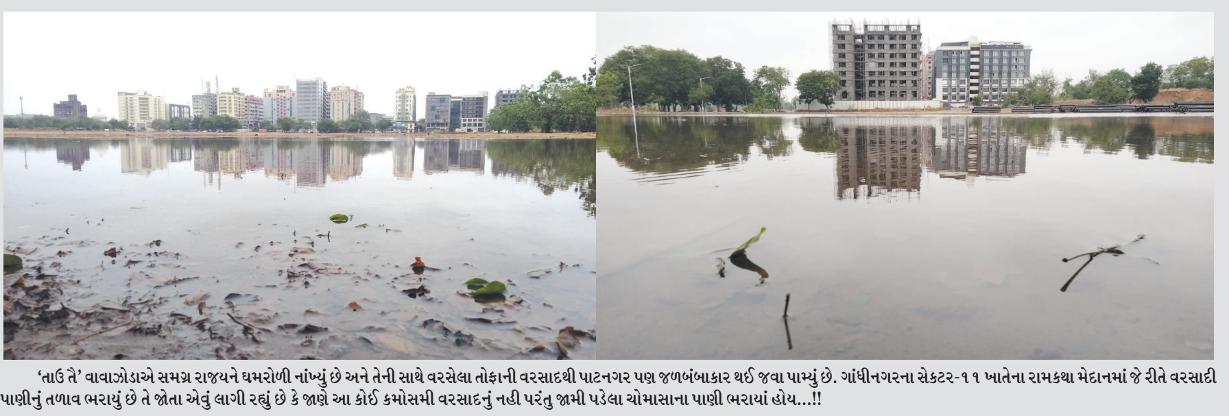
'તાઉ તે' વાવાઝોડાએ સમગ્ર રાજ્યને ધમરોળી નાંખ્યું છે અને તેની સાથે વરસેલા તોફાની વરસાદથી પાટનગર પણ જળબંબાકાર થઈ જવા પામ્યું છે. ગાંધીનગરના સેક્ટર-૧૧ ખાતેના રામકથા મેદાનમાં જે રીતે વરસાદી પાણીનું તળાવ ભરાયું છે તે જોતા એવું લાગી રહ્યું છે કે જાણે આ કોઈ કમોસમી વરસાદનું નહીં પરંતુ જામી પડેલા ચોમાસાના પાણી ભરાયાં હોય...!!!