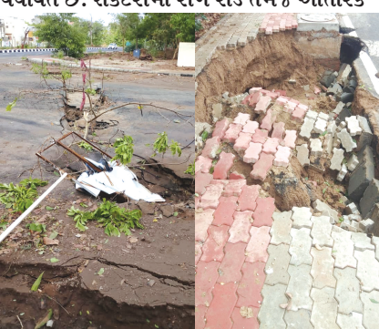
માર્ગો પર ગાબડા અસ્તિત્વમાં આવ્યા છે. પરંતુ નવા સેક્ટરોમાં હજુ ગાબડા પુરવા માટે તંત્રની ટીમ કામે લાગી નથી. જેના લીધે વાહનચાલકો ગમે ત્યારે અકસ્માતનો ભોગ બને તેવી સ્થિતિ છે. જ્યારે મુખ્યમાર્ગો આસપાસની કુટપાથ ઉપર પણ મોટામસ ગાબડા પડ્યા છે. ખ માર્ગ તેમજ સે-૩ માં કુટપાથ આખી કુટપાથ જમીનમાં ગરકાવ થઈ ગઈ છે. મોતના કુવા સમાન બનેલા વોક ડે ગમે ત્યારે જાનલેવા અકસ્માતનું કારણ બને તેવી દહેશત છે. કુટપાથ નીચે અંગાઉ વરસાદી પાણીના નિકાલ માટે ખોદકામ કરાયું હતું જ્યારે આ કામગીરીના અંતે યોગ્ય માટી પુરાણ ન થતા માત્ર ૪ ઈંચ વરસાદમાં