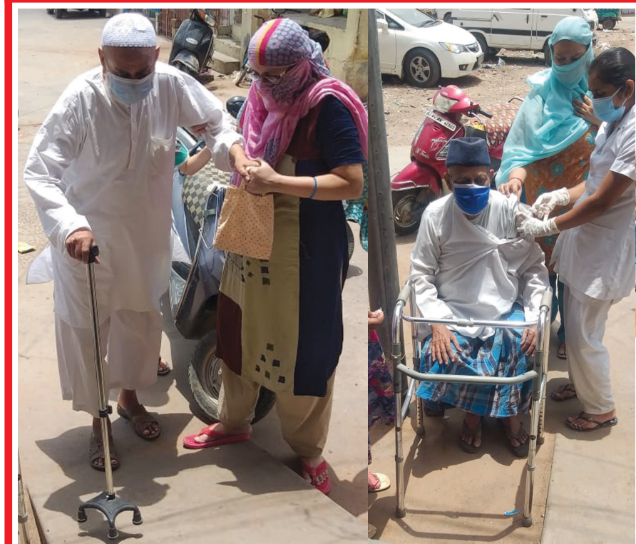
પ્રાંતિજ વ્હોરવાડ ખાતે કોવિડ રસીકરણનો કેમ્પ યોજાયો : ૧૦૦થી વધુ લોકોને રસી અપાઈ

સારવાર લેવા જતાં ખાલી બેડ મળવો પણ મુશ્કેલ હોવાથી અન્ય સંક્રમિત દર્દીઓ કપરા કાળમાં જાય તો જાય ક્યાં જેવી સ્થિતિનું નિર્માણ થયું હતું. મોટાભાગની હોસ્પિટલો હોસ્પિટલો થઈ જતાં દર્દીનો જીવ બચાવવા પરિવારજનોને અમદાવાદ, ગાંધીનગર, વડોદરા સહિતના શહેરોની હોસ્પિટલો સુધી દોડવાની ફરજ પડી હતી પરંતુ ગાઉતે વાવાઝોડું આવ્યું અને કોરોના સંક્રમણને સાથે ઉડાવી ગયું હોય તેમ આશ્ચર્ય વચ્ચે કેસની સંખ્યામાં નોંધપાત્ર ઘટાડો થયો છે. કોવિડ હોસ્પિટલો તેમજ કોવિડ કેર સેન્ટરોમાં સારવાર લેનારા દર્દીઓની સંખ્યા ઘટતાં આરોગ્ય તંત્રએ અંદરખાને રાહતની લાગણી અનુભવી છે.