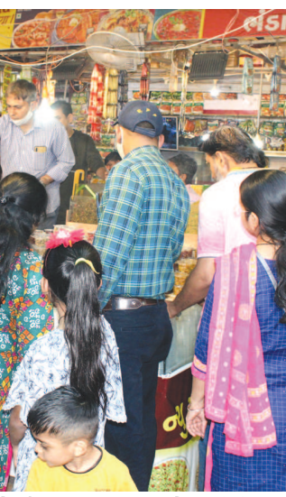
ખરીદીનો દોર સતત ચાલુ રહ્યો હતો. આજે દિવાળી પુર્વના દિવસે પણ નગરના