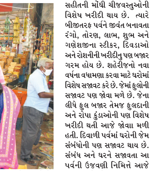
વિશિષ્ટ પ્રકારનું સુશોભન કરે છે. રોશનીની ઝાકમઝાળ વચ્ચે રંગોળી અને દિવડાઓની હારમાળાથી