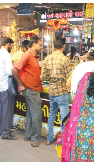
એતિહાસિક ભીડના દ્રશ્યો પણ જોવા મળ્યા હતા. જ્યારે આજે દિવાળી પુર્વના દિવસે પણ નગરના

સંબંધોની સાથે ઘરની સજાવટ કરવા માટે નગરજનો છેલ્લી ઘડી સુધી ખરીદી કરી : ઘર સુશોભનને અનુલક્ષી તોરણ, સ્ટીકર, રંગ, દિવડાઓ અને રોશની ખરીદી માટે બજારમાં ભીડ જામી