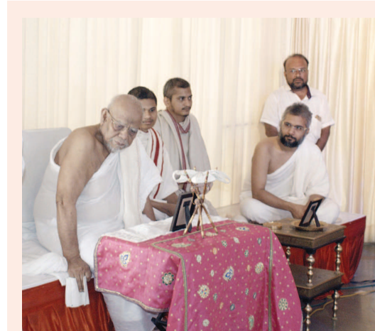
લાભ પાંચમને જ્ઞાન પંચમી તરીકે પણ ઓળખવામાં આવે છે અને આ દિવસે સરસ્વતીનું પૂજન કરવામાં આવે છે. ગાંધીનગરના સે. ૨૨ માં જૈન સંઘના આંગણે યાતુર્માસ અર્થે બિરાજમાન રાષ્ટ્રસંત પૂ. પદ્મસાગર સુરિશ્વરજી મ.સા. સહિત જૈનાચાર્યોની નિશ્રામાં સરસ્વતી પૂજનનું ભવ્ય આયોજન કરવામાં આવ્યું હતું જેમાં મોટી સંખ્યામાં જૈન શ્રદ્ધાળુઓ ઉપસ્થિત રહ્યાં હતા.