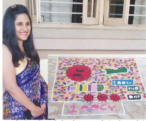
વેક્સીન અભિયાનને પ્રોત્સાહિત કરવા માટે થીમ બેનર રંગોળી બનાવવાઈ હતી. આ રંગોળી શૈલી વાગ્મિન બૂચ દ્વારા તૈયાર કરવામાં આવી હતી.