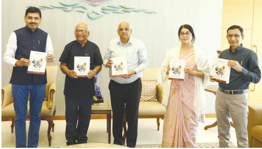
ગુજરાત સાહિત્ય અકાદમીના મુખ્યમંત્રી મુખ્યમંત્રીના હસ્તે વિમોચન

અમદાવાદ, તા. ૨૩ આવકવેરા વિભાગે ગુજરાતના નામી શુપ્સ એસ્ટ્રલ પાર્થસ અને રત્નમણી મેટલ્સ વિરુદ્ધ મેગા ઓપરેશન હાથ ધર્યું છે. આવકવેરા વિભાગના અમદાવાદમાં એકસાથે ૨૫