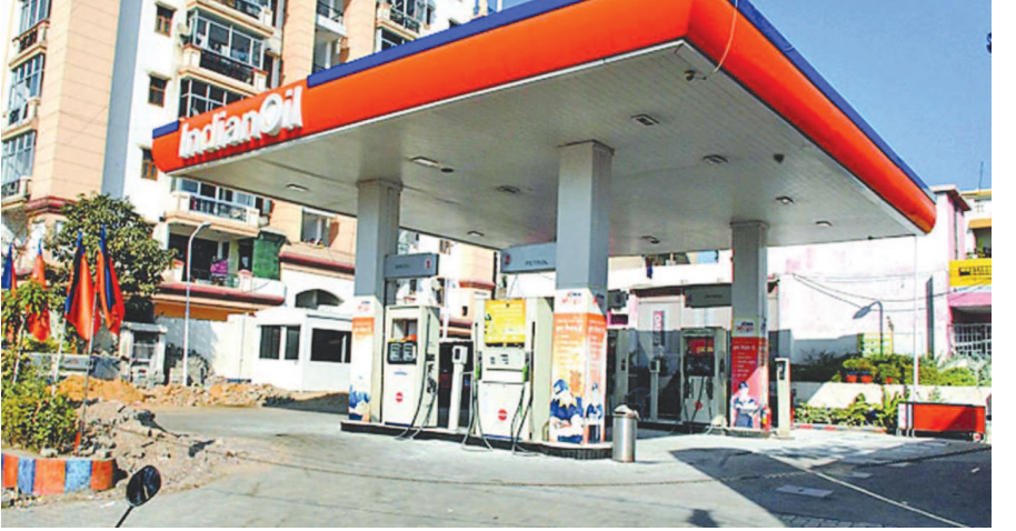
છે. ત્રણ દિવસ પહેલા પેટ્રોલ ૯૯.૨૯ પ્રતિ લિટર અને ડીઝલ ૯૭.૯૯ પ્રતિ લિટર હતું. છેલ્લા ૧૦ દિવસમાં ગાંધીનગરમાં પેટ્રોલની કિંમત ૯૯.૪૬ થી ૧૦૦.૬૯ રૂપિયા વચ્ચે વધઘટ થઈ રહી છે. પેટ્રોલના ભાવમાં છેલ્લો ફેરફાર ૭ ઓક્ટોબરના રોજ થયો હતો અને તેમાં +૦.૦૩૭ રૂપિયાનો વધારો કરવામાં આવ્યો હતો.

અને મધ્યમવર્ગના ટુ ટ્વીલર વાહનચાલકો અને માંડ માંડ ગાડી ખરીદવાનો જુગાડ કર્યો હોય એવા મધ્યમવર્ગના લોકો માટે કમરતોડ સાબિત થતો હોય છે. આખરે સચિન તેનુલકરની સેન્ચુરી પેટ્રોલ ડીઝલના ભાવે મારી દીધી છે. શહેરીજનો મજબુરીનું નામ મહાત્મા ગાંધી એમ લાચારી વશ આટલા ઉંચા ભાવે પણ પેટ્રોલ- ડીઝલ પુરાવી રહ્યા છે. પોતાના ખર્ચને પહોંચી વળવા સરકાર પાસે બીજા અનેક માર્ગો છે તેમ છતાં મધ્યમ અને ગરીબ વર્ગને હંમેશા મોંઘવારીનો માર વેઠવો પડે છે. ગાંધીનગરમાં પેટ્રોલની કિંમતો વધુ અસ્થિર થઈ રહી