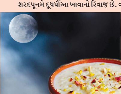
લેક્ટિક એસિડ હોય છે. જે ચંદ્રના કિરણોમાંથી જંતુનાશક શક્તિ મેળવે છે. ચોખાના સ્વાર્યાના ઉમેરાથી આ પ્રક્રિયાને વધુ વેગ મળે છે.