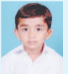
ભાગ્ય સુહાગ વોરા