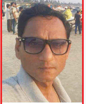
ચુનેન્દ્રભાઈ પટેલ વિવેકાન્દ સોસાયટી બાયડ