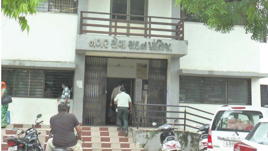
લાખથી વધારે વીજ બીલ બાકી નિકળતા આખરે વિજ કંપનીના પ્રાંતિજ વિજ કંપનીના યાદવ દ્વારા આજે પાલિકાના મેન ઓફિસનુ વિજ જોડાણ

પ્રાંતિજ તા.૨૭ સાબરકાંઠા જિલ્લાના પ્રાંતિજ ખાતે આવેલ ભાજપ શાસિત નગરપાલિકાનુ વિજ જોડાણ કપાયુ. વર્ષમા બીજવાર વિજ જોડાણ કપાયુ. પ્રાંતિજ ખાતે આવેલ પ્રાંતિજ નગરપાલિકા દ્વારા વિજ કંપનીની વીજ બીલ ના ભરતા પ્રાંતિજ વિજ કંપની દ્વારા આજે પ્રાંતિજ નગરપાલિકાનુ વીજ જોડાણ કપાયુ હતુ તો દિવાળી ટાળે જ પાલિકાનુ વિજ જોડાણ કપાતા પ્રાંતિજ પાલિકામા અંધારપટ છવાયો હતો.