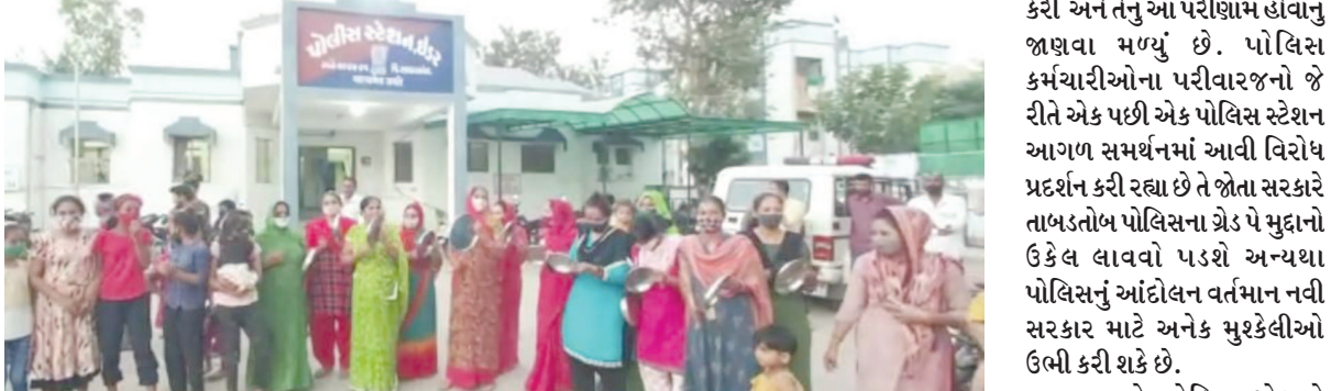
પેમાં થતા અન્યાયની ગૂંજ હવે ગાંધીનગરથી રાજ્યની ચારે દિશાઓ તરફ ફરીવળી છે. ગ્રેડ પે મુદ્દે પોલિસ કર્મચોરો આંદોલન છેડે તો સામી દિવાળીએ સરકાર અને વહિવટીતંત્રની મુકેલી વધી શકે છે.

બાયડ(બ્યુરો ઓફિસ), તા.૨૭ પોલીસ કર્મચારીઓને ગ્રેડ કરવાની માંગ કરી છે જ્યારે પોલીસના ગ્રેડ પે આંદોલનને કોંગ્રેસ રાજ્યમાં સમર્થન મળ્યું તે જોતાં અન્ય વિભાગના આંદોલનકારીઓ