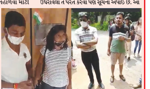
એન્ટ્રી પ્રવાસીઓ માટે વિનામૂલ્યે છે, છતાં વી વસૂલાત ગેરકાયદેસર છે અને ભવિષ્યમાં આનું ન બને તે બાબતની કાળજી રાખવા કડક સૂચના આપી તાકીદ કરાઈ છે. કોઈપણ પ્રવાસી સાથે આનું થાય તો વહીવટી તંત્ર અને ફોરેસ્ટ વિભાગના નાયબ વન સંરક્ષક તથા અન્ય અધિકારીઓનું ધ્યાન દોરવા એક અખબારી યાદીમાં જણાવવામાં આવ્યું છે. આ પ્રવાસન સ્થળ જિલ્લાની એક આગવી ઓળખ છે જે કાયમ લોકોમાં બની રહે તેવા પ્રયત્નો કરવા જણાવવામાં આવ્યું છે.

સાબરકાંઠા જિલ્લાના વિજયનગર પોળો ફોરેસ્ટમાં રાજ્યના વિવિધ જિલ્લાઓ માંથી પ્રવાસીઓ કુદરતી પ્રકૃતિ સૌંદર્ય નિહાળવા મોટી સંખ્યામાં આવતા હોય છે. પોળો ફોરેસ્ટ ખાતે પ્રવાસીઓ કેટલાક ખાનગી તેમ જ ફોરેસ્ટ ગાઈડ દ્વારા પ્રવાસીઓને આસપાસના પ્રવાસન સ્થળો બતાવવા માટે ગાઈડ રાખતા હોય છે. પ્રવાસીઓના ધસારાને ધ્યાને લઈને કેટલાક લોકો દ્વારા ઓફીસ ખોલીને એન્ટ્રી ફી ના નામે રૂ. ૫૦ વસૂલાતા હોવાના અહેવાલને પગલે પ્રવાસીઓને જંગલ દર્શન કરાવતા હોવા અંગેનો એક વીડિયો સોશિયલ મીડિયામાં વાઈરલ થતાં વહીવટી તંત્ર અને ફોરેસ્ટ વિભાગ એકશનમાં આવ્યું છે. આ અંગે જિલ્લા કલેક્ટર શ્રી હિતેષ કોયા દ્વારા તાત્કાલિક બેઠક બોલાવીને તપાસ કરાતા ફોરેસ્ટ વિભાગનો ગાઈડ કેટલાક લોકોને એન્ટ્રી ફી ના નામે વધારાના પૈસા લઈને પોળો ફોરેસ્ટમાં એન્ટ્રી ફી ના નામે પૈસા ઉઘરાવતો હોવાની હકીકત સામે આવતા ગાઈડને તાત્કાલિક ધોરણે ત્યાંથી છુટા કરાયા છે અને તેમના ઉપર પોલીસ ફરિયાદ કરવાની સૂચના આપી છે, તથા એન્ટ્રી ફી ના નામે પ્રવાસીઓ પાસેથી જે પૈસા ઉઘરાવેલા તે પરત કરવા પણ સૂચના આપાઈ છે. આ