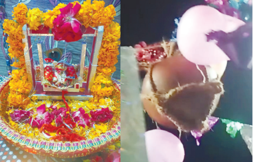
જિલ્લામાં શ્રદ્ધા-ઉમંગ સાથે ઉજવણી કરવામાં આવી હતી. પ્રવેશ આપવામાં આવ્યો હતો. કોરોનાના કારણે મટકી ફોડ, સાથે જ શામળાજીમાં ભક્તિ-આસ્થાનો અનેરો મહાસાગર

પોલીસ તંત્ર દ્વારા ખાસ ચોંપતો બંદોબસ્ત ઉભો કરવામાં આવતાં કૃષ્ણઘેલા ભક્તોએ