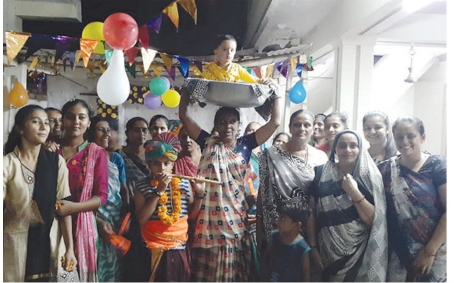
વિસ્તારોમાં કૃષ્ણ જન્મોત્સવ નિમિત્તે સાદગી સાથેની પાવન પર્વ શાંતિપૂર્ણ રીતે સંપન્ન થાય તે માટે બંને જિલ્લામાં નિર્વિઘ્ને જન્માષ્ટમીના પર્વની ઉજવણી કરી હતી.