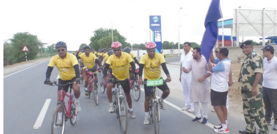
બીએસએફ જવાનો ની સાઈકલ યાત્રા નીકળી છે અને આ સાયકલ રેલી ગુજરાત રાજસ્થાન પંજાબ સહિતના વિવિધ રાજ્યો અને

વિવિધ શહેરોમાં વિવિધ સંદેશ સાથે ફરી રહી છે અને આ સાયકલ યાત્રા બીજી ઓક્ટોબરના દિવસે દાંડી મુકામે