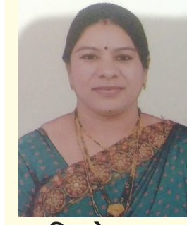
માલવિકાબેન ગજજર સોરારુ કચ્છ સમાજ