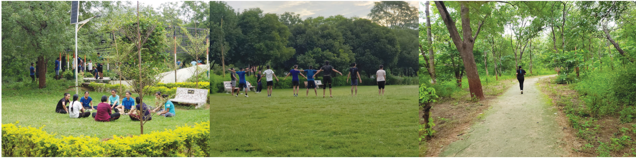
વહેલી સવારે શહેરના બાગ બગીચાઓમાં યોગ, કસરત, વોર્કિંગ કરવા માટે શહેરીજનો જોવા મળી રહ્યા છે. નાગરિકોમાં પોતાની ફીટનેશ પ્રત્યે જાગૃતતા જોવા મળી રહી છે. વહેલી સવારે પુનિતવન, મહાત્મા મંદિરના ગાર્ડનમાં ઉપરાંત બાગ બગીચાઓ અને માર્ગો પર નાના બાળકોથી લઈ સિનિયર સિટિઝનો કસરત કરવા માટે આવે છે. ઉપરાંત આગામી સમયમાં ભરતીઓ હોવાના કારણે યુવાનો તેની પ્રેક્ટિસ કરતા જોવા મળી રહ્યા છે.