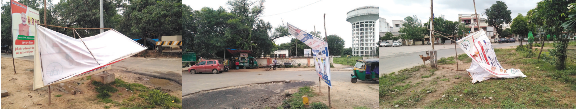
વાવાઝોડાની અસરને લીધે શહેરમાં પવનની ગતિ તેજ જોવા મળી છે. પવનની ગતિના કારણે ઠેર ઠેર લગાવાયેલા હોર્ડિંગ્સ ટુટી ગયા છે. હાલમાં ગાંધીનગર મનપાની સુંટણી હોઈ ઘણા સ્થળોએ વિશાળ હોર્ડિંગ્સ લગાવાયા છે. જે પૈકી ઘણા હોર્ડિંગ્સ ટુટી ગયા છે.