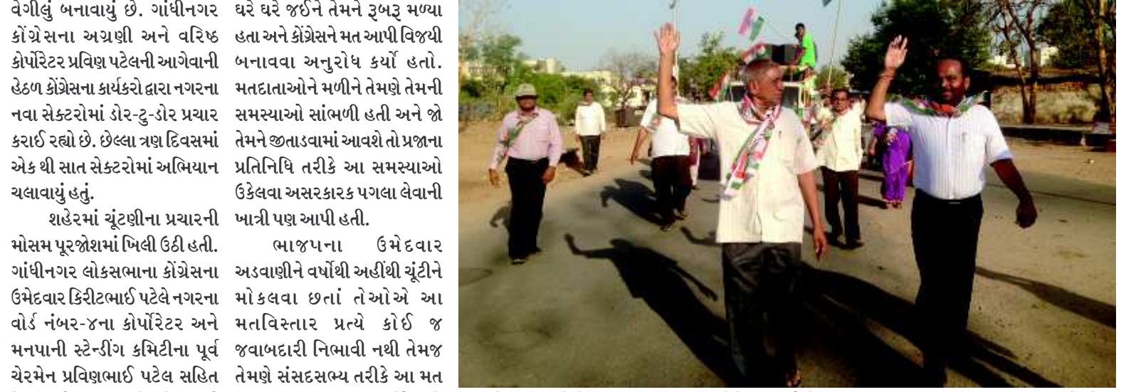
કોંગ્રેસના કાર્યકરોના ઉલ્લાસથી મળી પ્રચાર અભિયાનને વેગ આપવાનું આયોજન કોંગ્રેસના ઉમેદવારો હાથ ધર્યું છે.