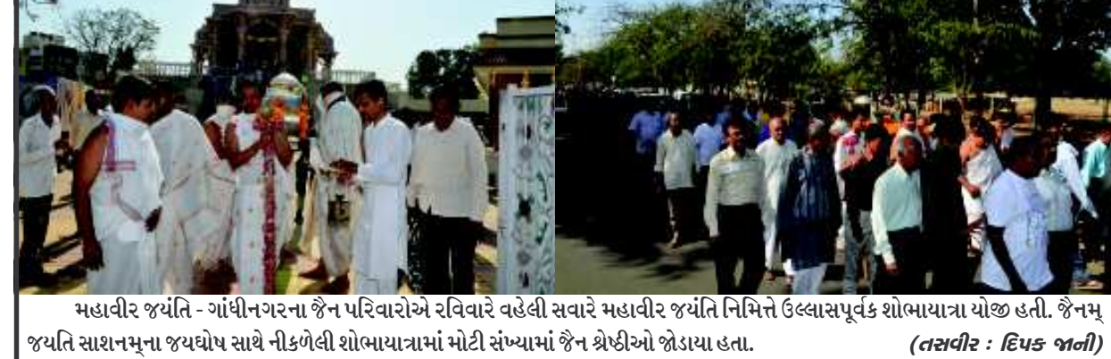
મહાવીર જયંતિ - ગાંધીનગરના જૈન પરિવારોએ રવિવારે વહેલી સવારે મહાવીર જયંતિ નિમિત્તે ઉલ્લાસપૂર્વક શોભાયાત્રા યોજી હતી. જૈનમ્ જયંતિ સાશનમૂના જયઘોષ સાથે નીકળેલી શોભાયાત્રામાં મોટી સંખ્યામાં જૈન શ્રેણીઓ જોડાયા હતા.