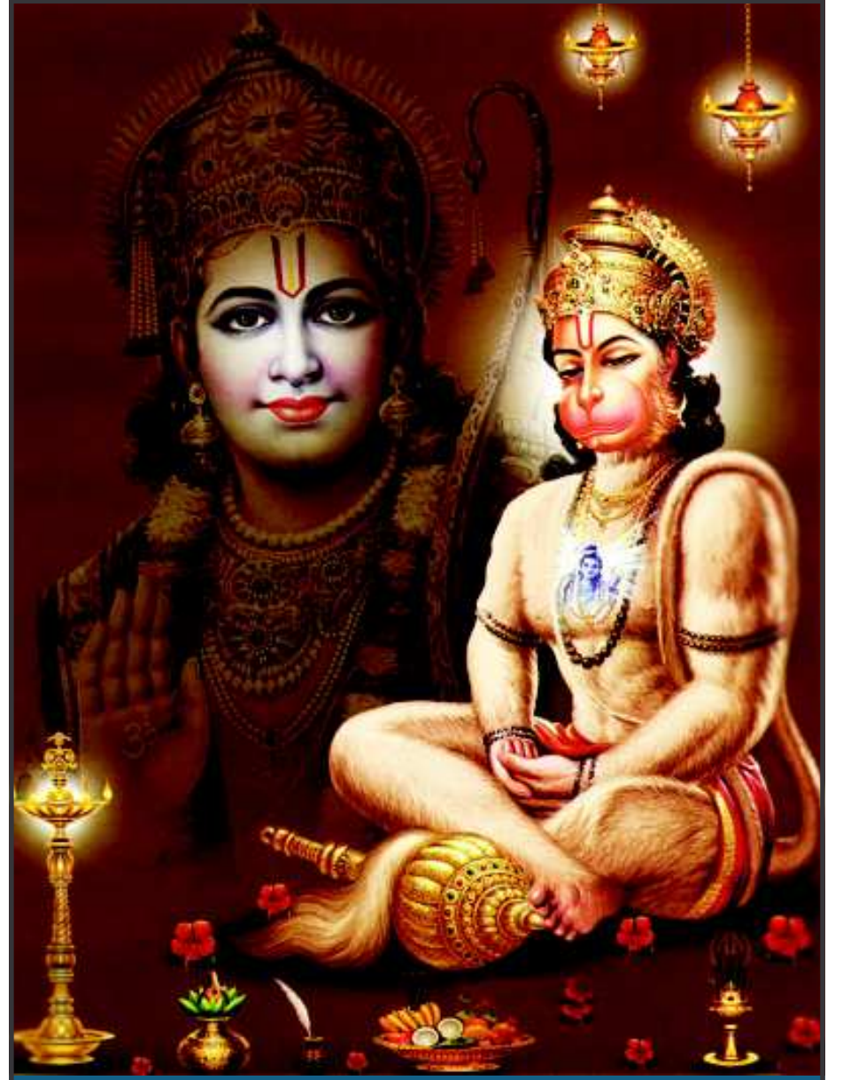
જય જય હનુમાન ગોસાઈ, કૃપા કરો ગુરૂદેવ કી નાચી

છંટકાવ કરવામાં આવ્યો હતો. સરકારનું હેલીપેડ ગાંધીનગર સચિવાલય ખાતે નવું બનાવાયું છે. મુખ્યમંત્રી શ્રી જ્યારે સરકારી કાર્યક્રમમાં જતા હોય છે ત્યારે આ હેલીપેડનો ઉપયોગ કરે છે. ચૂંટણીની આ મોસમમાં કોબા નજીક કામચલાઉ હેલીપેડ બનાવવામાં આવતાં આજે પોલીસનો પણ બંદોબસ્ત ત્યાં લગાવવામાં આવ્યો હતો.