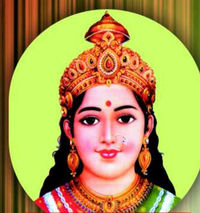
શ્રી ચેહર મહાચંડિકાચેં નમઃ