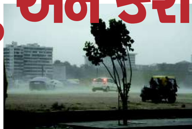
● અનુસંદાન પાલ-૭ પર

ગાંધીનગર, તા. ૨૦ વેસ્ટર્ન ડિસ્ટર્બન્સને પગલે મધ્યપ્રદેશથી નોર્થ પાકિસ્તાન વચ્ચે સર્જાયેલ ઓફ શોર સિસ્ટમ સર્જતાં આજે રાજ્યના વિવિધ વિસ્તારોમાં વાતાવરણમાં પલટો આવ્યો હતો તેમજ કરા સાથેનો વરસાદ પડતાં સમગ્ર રાજ્યમાં ચિંતાનો માહોલ પ્રસરી જવા પામ્યો હતો. આજે મોડી સાંજે ગાંધીનગર સહિત રાજ્યના સૌરાષ્ટ્ર અને ઉત્તર ગુજરાત પંથકમાં વાતાવરણમાં પલટો આવ્યો હતો. પવન સાથે કરાનો વરસાદ પણ પડ્યો હતો. ૩૦ મિનિટથી પણ વધુ સમય સુધી પડેલા વરસાદને કારણે પાટનગરમાં ઠેર ઠેર પાણી ભરાઈ જવા પામ્યા હતા. પવન સાથે આવેલા વરસાદને યોમાસાનો માહોલ હોય તેવું લાગતું હતું.