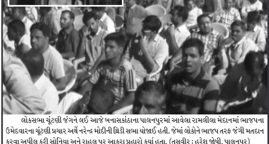
(લોકસભા યૂંટણી જંગને લઈ આજે બનાસકાંઠાના પાલનપુરમાં આવેલા રામલીલા મેદાનમાં ભાજપના ઉમેદવારના યૂંટણી પ્રચાર અર્થે નરેન્દ્ર મોદીની ટ્રિડી સભા યોજાઈ હતી. જેમાં લોકોને ભાજપ તરફ જંગી મતદાન કરવા અપીલ કરી સોનિયા અને રાહુલ પર આકરા પ્રહારો કર્યા હતા.

સૂત્રો પાસેથી પ્રાપ્ત વિગતો મુજબ યૂંટણી દરમિયાન કોઈ પણ પ્રકારની વસ્તુનું મતદારોને વિતરણ કરવું એ યૂંટણી આચારસંહિતાનો ભંગ છે. બરોડા શહેરમાં ભાજપ મહિલા કાર્યકરો દ્વારા ભાજપના કમળના નિશાન વાળી શુંગારની વસ્તુઓની કીટોનું મહિલાઓને વિતરણ કરવામાં આવી રહ્યું હતું. આ કિટોના વિતરણ સામે બરોડા કોંગ્રેસ દ્વારા વિરોધ કરીને આ યૂંટણી આચાર સંહિતાનો ભંગ ગણાવીને આ મામલે યૂંટણી પંચને ફરિયાદ કરવામાં આવેલી હોવાનું જાણવા મળે છે.