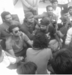
દેશ વિરોધી તત્વો દ્વારા કરવામાં આવે છે. રામદેવ ભાજપના એજન્ટ તરીકે કામ કરી રહ્યા છે. રામદેવ સેવાની આડમાં ધંધો કરી રહ્યા છે. ત્યારે દેશની જનતા આ પાખંડીને ઓળખી ગઈ છે. કોંગ્રેસ પાર્ટીના ઉપાધ્યક્ષ રાહુલ ગાંધીની ઉપર અભદ્ર ટીપ્પણી કરનાર રામદેવ પોતાના સંસ્કાર દેશ સામે છતાં કર્યા છે. જેને લઈ દેશના દલિત સમાજમાં તેના ઘેરા પ્રત્યાઘાત પડી રહ્યા છે. પરિણામે ગાંધીનગર,

ગાંધીનગર, તા. ૨૭ કલોલ, સુરત અને અમદાવાદ જેવા શહેરમાં પાખંડી રામદેવ સામે સૂત્રોચ્ચારો કરી પુતળાદહન જેવા કાર્યક્રમો દલિત સમાજના યુવાનો દ્વારા આપવામાં આવ્યા હતા.