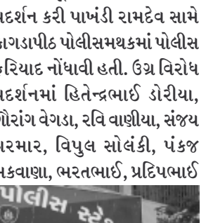
દેશ વિરોધી તત્વો દ્વારા કરવામાં આવે છે. રામદેવ ભાજપના એજન્ટ તરીકે કામ કરી રહ્યા છે. રામદેવ સેવાની આડમાં ધંધો કરી રહ્યા છે. ત્યારે દેશની જનતા આ પાખંડીને ઓળખી ગઈ છે. કોંગ્રેસ પાર્ટીના ઉપાધ્યક્ષ રાહુલ ગાંધીની ઉપર અભદ્ર ટીપ્પણી કરનાર રામદેવ પોતાના સંસ્કાર દેશ સામે છતાં કર્યા છે. જેને લઈ દેશના દલિત સમાજમાં તેના ઘેરા પ્રત્યાઘાત પડી રહ્યા છે. પરિણામે ગાંધીનગર,