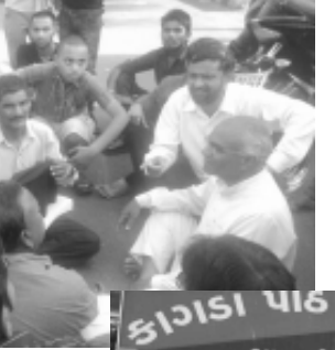
દેશ વિરોધી તત્વો દ્વારા કરવામાં આવે છે. રામદેવ ભાજપના એજન્ટ તરીકે કામ કરી રહ્યા છે. રામદેવ સેવાની આડમાં ધંધો કરી રહ્યા છે. ત્યારે દેશની જનતા આ પાખંડીને ઓળખી ગઈ છે. કોંગ્રેસ પાર્ટીના ઉપાધ્યક્ષ રાહુલ ગાંધીની ઉપર અભદ્ર ટીપ્પણી કરનાર રામદેવ પોતાના સંસ્કાર દેશ સામે છતાં કર્યા છે. જેને લઈ દેશના દલિત સમાજમાં તેના ઘેરા પ્રત્યાઘાત પડી રહ્યા છે. પરિણામે ગાંધીનગર,