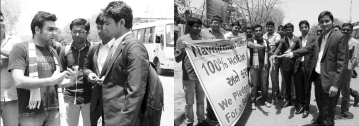
સમગ્ર દેશમાં આ વખતની ચૂંટણીને લઈને મતદાતાઓમાં અને સેવાભાવી સંસ્થાઓમાં ઉત્સાહ વધારે છે ત્યારે ગાંધીનગરની કડી કોલેજની બહાર નવ નિર્માણ સેના અને ધ હેલપીંગ હેન્ડ્સ દ્વારા સો ટકા મતદાન કરવા માટે જન જાગૃતિ અભિયાન યોજવામાં આવ્યું હતું. અભિયાનમાં કોલેજના ૮૦૦ થી વધારે વિદ્યાર્થીઓને મતદાન વિશેની વિસ્તૃતમાં માહિતી પુરી પાડવામાં આવી હતી.