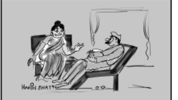
તમે મને ખોટા વાઘવા કર્યા હતાં તેનું શું પરિણામ આવ્યું તે યાદ કરો, અને વિચારો પ્રજાને આટલા બધા ખોટા વાઘવાનું પરિણામ શું આવશે?