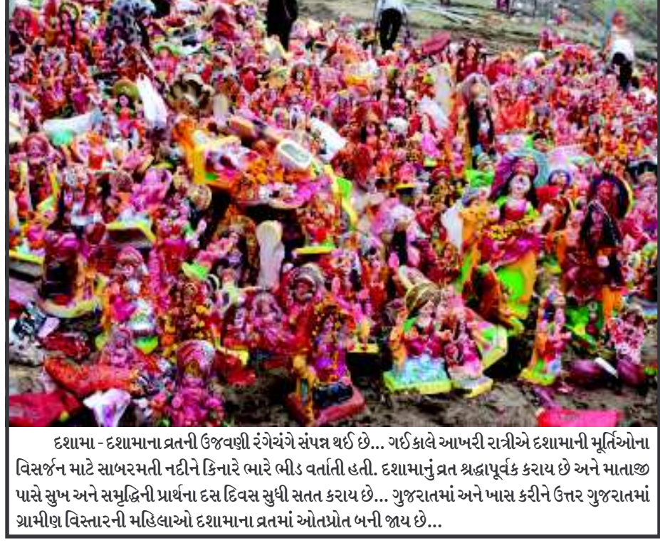
દશામા - દશામાના વ્રતની ઉજવણી રંગેરંગે સંપન્ન થઈ છે... ગઈકાલે આખરી રાત્રીએ દશામાની મૂર્તિઓના વિસર્જન માટે સાબરમતી નદીને કિનારે ભારે ભીડ વર્તાતી હતી. દશામાનું વ્રત શ્રદ્ધાપૂર્વક કરાય છે અને માતાજી પાસે સુખ અને સમૃદ્ધિની પ્રાર્થના દસ દિવસ સુધી સતત કરાય છે... ગુજરાતમાં અને ખાસ કરીને ઉત્તર ગુજરાતમાં ગ્રામીણ વિસ્તારની મહિલાઓ દશામાના વ્રતમાં ઓતપ્રોત બની જાય છે...

આ બન્ને દર્દીઓ હાલ અમદાવાદ સોલા હોસ્પિટલમાં સારવાર હેઠળ હોવાનું અને તબિયત સ્થિર હોવાનું જાણવા મળેલ છે. બીજી તરફ ગાંધીનગર નજીક આવેલ પાલજ ખાતે નિર્માણાધીન આઈ.આઈ.ટી. સંકુલના મજૂરોમાં મેલેરિયાના ચાર થી વધુ પોસ્ટીટીવ કેસ મળી આવતાં મેલેરિયાની ટીમ પણ આ સંકુલ ખાતે દોડી ગઈ હતી. મજૂરોનું તાકીદે સ્ક્રીનિંગ કરી અને તેમને દવાઓ પણ અપાઈ હોવાનું જાણવા મળેલ છે.