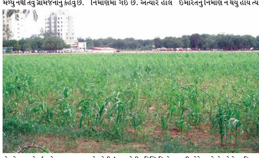
મળ્યું નથી તેવું ગ્રામજનોનું કહેવું છે. નિર્માણમાં ગઈ છે. અત્યારે હાલ ઈમારતનું નિર્માણ ન થયું હોય ત્યાં

ગાંધીનગર, તા. ૨૨ ગાંધીનગર શહેરની મધ્યમાં લહેરાતા ખેતરો જોવા મળે છે. ઈન્દ્રોડા ગામના અસરગ્રસ્ત ખેડૂતો દ્વારા અંદાજિત ૫૦ વિધા જમીનમાં ચોમાસા દરમિયાન વાવણી કરવામાં આવે છે. જેમાં બાજરી, ગવાર, જીર અને કાકડીનું વાવેતર કરવામાં આવ્યું છે. ગાંધીનગર સૌનું છતાં કોઈનું નહીં તેવું આ નગર આસપાસના ગામની જમીન એકઠી કરી નિર્માણ પામ્યું છે. શહેરે એકાવન વર્ષમાં મંગળ પ્રવેશ કર્યો છે છતાં અસરગ્રસ્ત ખેડૂતોના પ્રશ્નો હજુ પણ યથાવત છે. સરકાર દ્વારા બાકી રહી ગયેલું પોતાનું વળતર હજુ સુધી ગ્રામજનોને