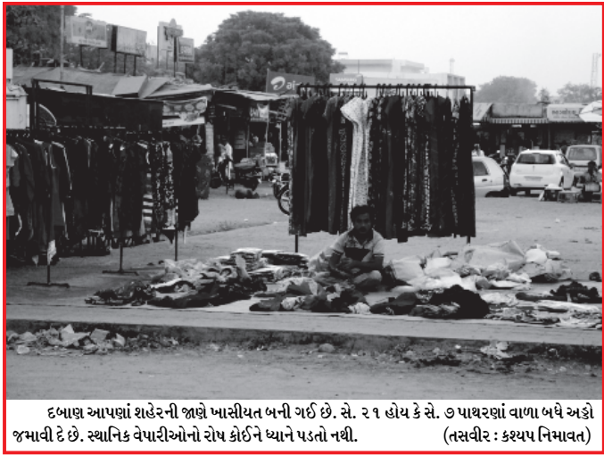
દબાણ આપણાં શહેરની જાણે ખાસીયત બની ગઈ છે. સે. ૨૧ હોય કે સે. ૭ પાથરણાં વાળા બધે અંજો જમાવી દે છે. સ્થાનિક વેપારીઓનો રોષ કોઈને ધ્યાને પડતો નથી.