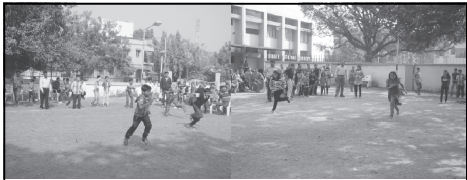
સેક્ટર-૭ ક્રોમ્યુનીટી હોલ ખાતે રવિવારે સવારથી જ શ્રી મોટા બાર ગામ કપડા પટ્ટીદાર સમાજ, ગાંધીનગર દ્વારા સ્નેહમિલનનો કાર્યક્રમ યોજાઈ ગયો. જેમાં અલગ અલગ રમતો અને સાંસ્કૃતિક કાર્યક્રમો અને વડીલોને સન્માનિત કરવાનો કાર્યક્રમ યોજવામાં આવ્યો હતો. જેમાં સમાજનાં ભાઈ બહેનોએ મોટી સંખ્યામાં ભાગ લીધો હતો.

ગાંધીનગર, તા.૨૯ કુડાસણ ખાતે આવેલી સ્કૂલ ઓફ એચિવર શાળાના વાલી ગણ માટે 'પ્રથમ પેરેન્ટ્સ સ્પોર્ટ્સ ડે' યોજાઈ ગયો. શહેરની પાસે આવેલ કુડાસણ ગામમાં શિક્ષણ આપતી સ્કૂલ ઓફ એચિવર શાળાના સંકુલમાં વિદ્યાર્થીઓના માતા પિતાનો સ્પોર્ટ્સ દિવસ યોજવામાં આવ્યો હતો. ૮૦૦થી વધારે વાલીઓએ ઉત્સાહભરે ભાગ લીધો હતો.